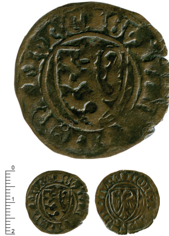
Double mite Guillaume II (1391-1418). Namur. Billon. 1,44 g. Diam. : 20 mm. Namur, TreM.a, Cabinet numismatique François Cajot. Coll. Société archéologique de Namur, inv. n° COL 008 43.

affectations différentes. Si certaines frappes sont ainsi réalisées de façon tout à fait conventionnelle, d'autres, destinées à l'exportation, prennent clairement un statut de marchandise. La production de monnaies-marchandises essentiellement composées de cuivre prend ainsi place dans l'industrie du cuivre qui fait alors la renommée de cette région. L'étude du monnayage namurois de cette période, et cela vaut sans doute pour d'autres seigneuries, devrait donc distinguer les productions à usage direct des productions destinées à la vente.