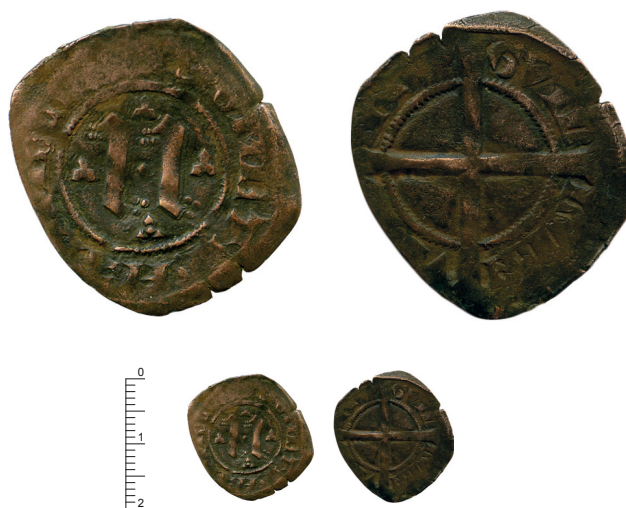
Mite au N

assurée durant tout le règne de Louis de Nevers et ne prend vraisemblablement fin qu'avec l'arrivée de Louis de Male en 1346. L'arrivée du nouveau comte ne vient pas perturber ce monnayage qui ne prend sans doute fin qu'avec l'introduction d'une nouvelle monnaie noire en 1376 : la double mite de Flandre au FL . Durant cette quarantaine d'années, la mite de Louis de Nevers se diffuse largement dans toute la Flandre et alentours comme en témoignent les nombreuses trouvailles sur des sites archéologiques, de Théroouanne à Anvers en passant par Tournai, Bruges, Oostenduikerke ou Deinze 11 . Cette monnaie, quoique de faible valeur, est copieusement imitée par de nombreuses seigneuries voisines dont le comté de Namur. Les imitations de la mite de Flandre frappées à Namur sont de trois sortes. Elles sont toutes au nom de Guillaume et attribuées de fait à Guillaume I er , comte de Namur de 1337 à 1391. La première reprend le type original et se contente de modifier discrètement les légendes. Très rare, on en connaissait surtout pour l'atelier de Namur 12 , mais un unique exemplaire atteste également une production à Bouvignes 13 . La fidélité de cette série par rapport au prototype, de même que la courte durée d'activité de l'atelier de Bouvignes concordent pour y voir une frappe précoce, probablement contemporaine de Louis de Nevers. La seconde série porte à la place du L majuscule un N gothique, pour Namur, entouré de quatre tiercefeuilles 14 .