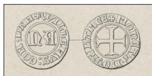
Dessin d'une double mite au nA à la place du FL Extrait de R. CHALON, Op. cit. , p. 81 et pl. IX, n° 139.

En 1376, l'introduction par Louis de Male (1346-1384), comte de Flandre, d'une nouvelle monnaie noire est à l'origine d'un nouveau mouvement, très vaste, d'imitations. Les émissions officielles flamandes perdurent au moins jusque sous Jean I er sans Peur (1404-1419) et se diffusent massivement dans tout le comté de Flandre et dans les provinces alentour. Le type, original, porte les lettres FL sous un trait d'abréviation dans le champ de l'avvers et une croix courte pattée au revers. Deux principales séries d'imitations ont été frappées à Namur au nom de Guillaume. La première, documentée par un exemplaire de la Société archéologique de Namur, est assez proche du prototype et porte un nA à la place du FL 28 . Elle n'a, à notre connaissance, été que très rarement retrouvée. La seconde, bien plus abondante, a elle aussi été décrite pour la première fois par E. Hucher en 1845 29 . Le FL y est remplacé par un grand N majuscule, entouré de deux annelets, et surmonté d'un trait d'abréviation. Tout en étant, par la croix courte et le trait d'abréviation, une indéniable imitation de la double mite au FL , cette série n'est pas sans rappeler la mite au L de Louis de Nevers par la présence des deux annelets.