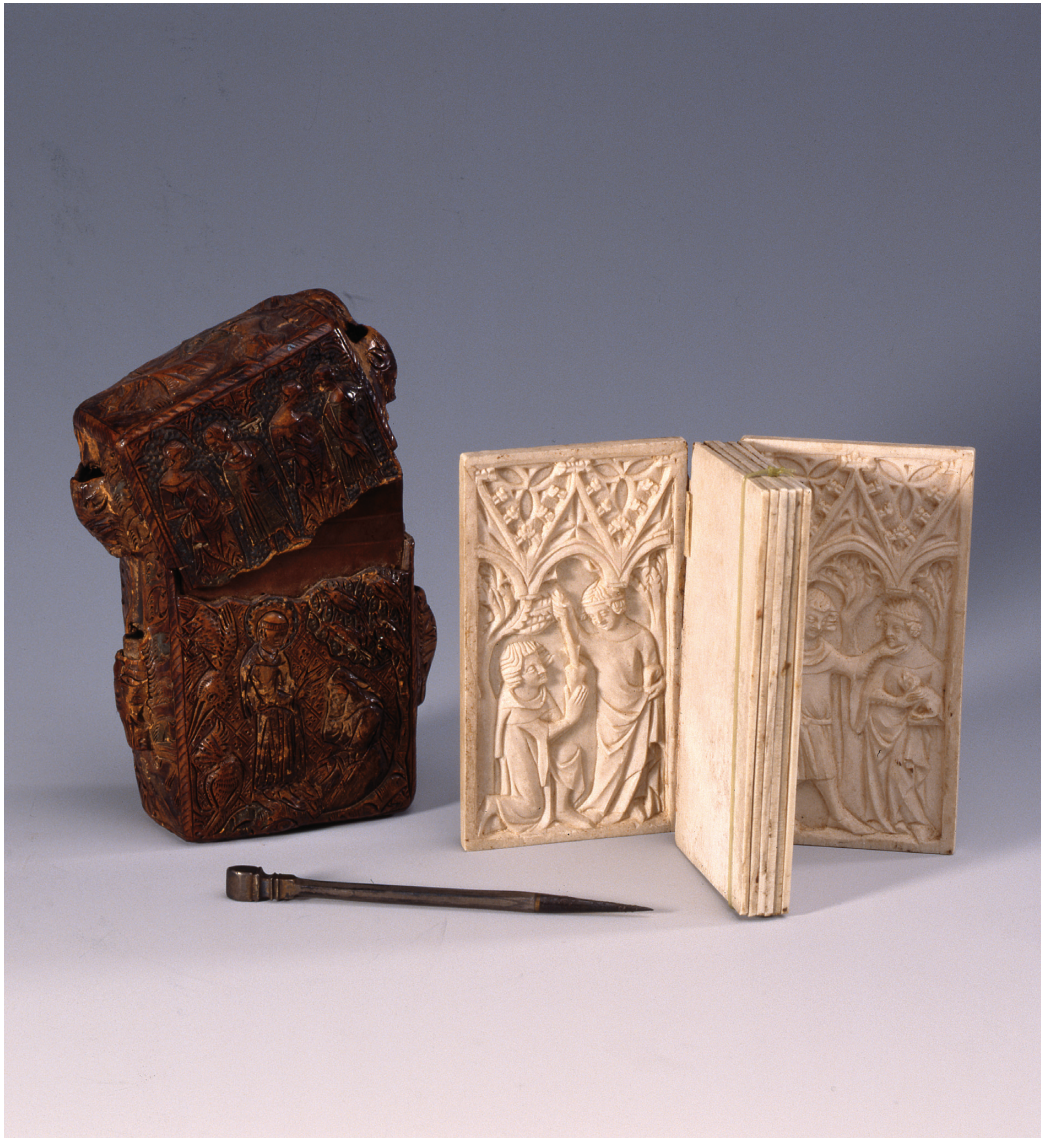
Tablette à écrire, étui et stylet ayant appartenu à Jeanne d'Harcourt, épouse du comte de Namur Guillaume II

Ivoire, cuir, argent. Paris. Milieu du xiv e siècle.