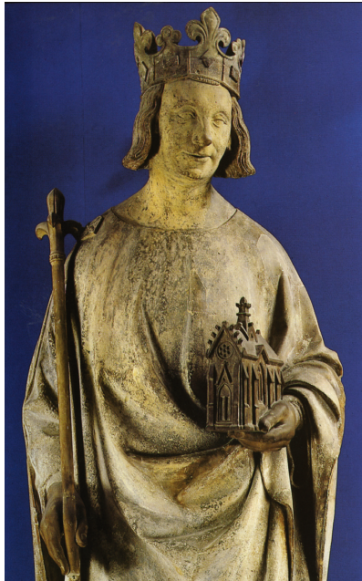
Charles V (détail) Vers 1365-1370.

Provenant du portail de l'ancien château du Louvre à Paris. Paris, Musée du Louvre.