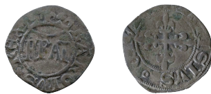
Denier parisis français Charles VI (1380-1422). Billon. 1,33 g. Diam. : 20,0 mm. Coll. privée.

et au revers un écu à l'aigle 38 . L'aire de circulation de ce monnayage se cantonne principalement au comté de Namur, même si quelques exemplaires ont été retrouvés ailleurs 39 .