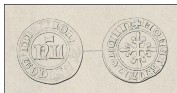
Dessin d'un hybride de la double mite de Flandre et du denier parisien français Extrait de R. CHALON, Op. cit. , p. 104 et pl. XIV, n° 201.

sont pas fausses, confirmer cette attribution. La première, découverte vraisemblablement à Namur et signalée en 1858, présente le type de la double mite au N , mais au nom de Jean (+IOhA [...]) 31 . Cette monnaie, attribuée à Jean I er (1297-1330) lors de sa publication, a par la suite été ignorée des numismates. Elle doit très probablement être attribuée à Jean III dit Thierry (1418-1429) dont le droit de monnayage se trouve suspendu en 1421 32 . La seconde, attribuée à Jean III par R. Chalon, est visiblement un hybride entre la double mite de Flandre et le denier parisien 33 . Ces deux monnaies, quoique anecdotiques, confirment la persistance de ce monnayage d'imitation sous Jean III. Ce dernier point permet d'assurer une datation tardive de cette série : 1400-1421 pour voir large. On peut en ces conditions proposer de rapprocher la double mite au N de Namur d'une mention, figurant dans le Du Cange, qui rapporte la présence de guillots et semi-guillots dans le Maine en août 1416, à raison de six pour un denier tournois 34 . Le parallèle de région, de nom et de valeur est frappant avec les guillots de 1378, et l'identification des doubles mites au N comme étant les guillots de 1416 est alors d'autant plus séduisante. Reste que deux monnaies, guillot et semi-guillot , sont mentionnées en 1416 et que nous n'en avons a priori retrouvé qu'une.