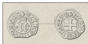
Dessin d'une double mite à la lettre N Extrait de R. CHALON, Op. cit. , p. 75 et pl. IX, n° 135.

La diffusion de cette double mite au N de Namur est étonnement similaire à celle de la double mite au lion. On ne la retrouve pas, excepté un exemplaire découvert au port du Grognon de Namur, dans les provinces belges. Elle est par contre fréquente dans l'Ouest français, principalement dans le Maine, l'Aunis et probablement la vallée de la Loire. Elle s'y mêle d'ailleurs avec de nombreux exemplaires de la double mite de Flandre officielle qui paraît circuler précisément dans le même espace. Les hypothèses émises au sujet de la double mite au lion sont également valables dans le cas de la double mite au N . Le lien entre ces deux séries est encore plus étroit si l'on considère les légendes, identiques jusqu'à la ponctuation par trois points superposés.