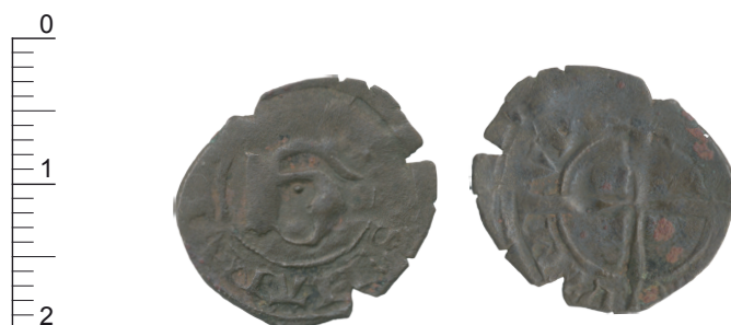
Mite au G

Ces imitations assez libres de la mite de Flandre ont probablement été frappées assez tardivement et ont dû servir de palliatif entre la fin des frappes officielles et l'introduction d'une nouvelle monnaie noire flamande en 1376 18 . Cette supposition semble renforcée par l'absence totale de ce monnayage dans les nombreux dépôts des années 1340-1360 comprenant des monnaies noires et mis au jour en Haute-Normandie 19 . Si l'on accepte de retenir une datation tardive pour ces séries, mettons 1360-1380, il paraît judicieux de les rapprocher de quelques mentions écrites venant préciser leur nature. Trois mandements sont adressés en 1373, 1374 et 1375 aux maîtres de Monnaies de Tournai, pour