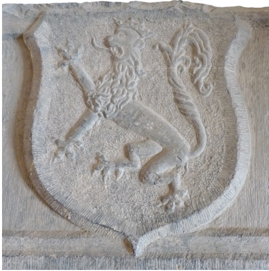
Pierre armoriée aux armes des comtes de Namur Trouvée dans les fouilles du Grognon. Namur, Ministère de la Région wallonne, Service de l'archéologie.