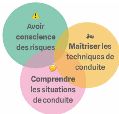
Figure 1: Concept prévention des risques routiers, HERNJA G. 2017

Cette nécessaire articulation de compétences variées permet également de montrer les limites d'une maîtrise des techniques de conduite sans compréhension des situations de conduite complexes de l'espace routier ou sans conscience des risques. Le motard qui se verrait comme un pilote sur route ouverte, sans conscience des risques et sans compréhension des dangers potentiels ne pourra pas entrevoir un avenir de conducteur sans dommages majeurs, pour lui ou pour ceux qu'il croisera.