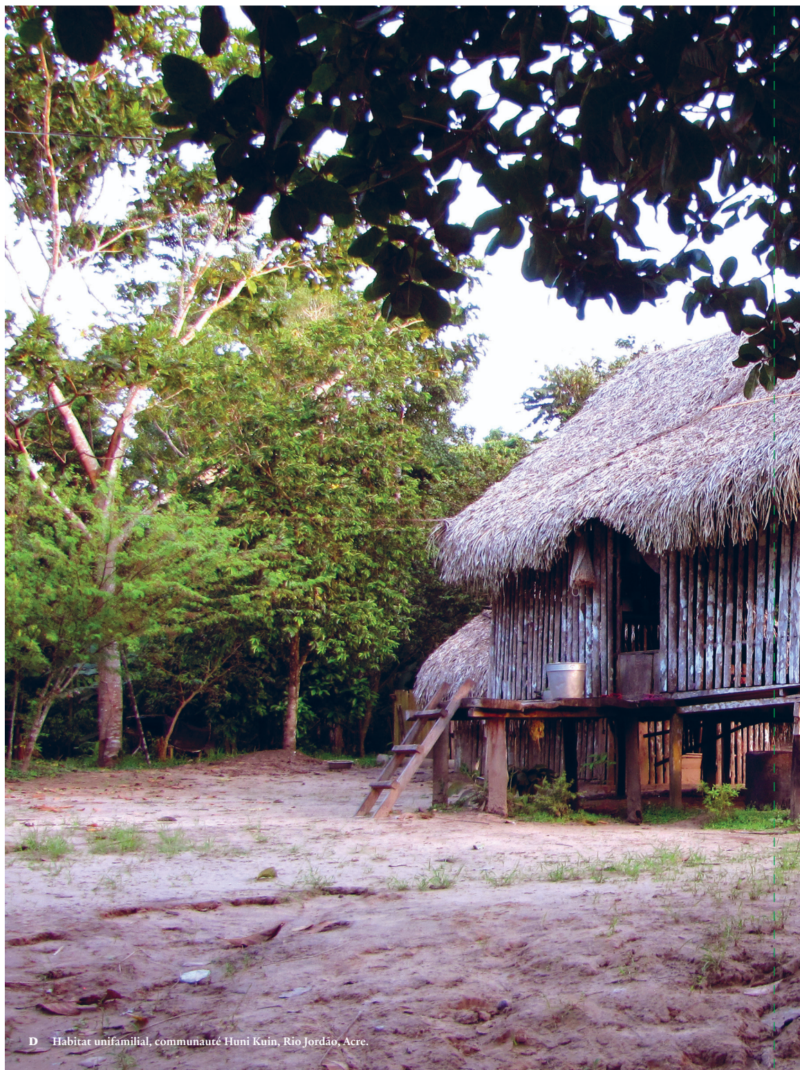
D Habitat unifamilial, communauté Huni Kuin, Rio Jordão, Acre.