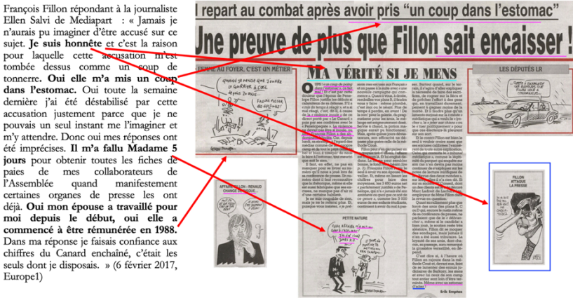
Figure 2 Renvois endophoriques multimodaux

La caricature trouve son antécédent dans le titre de l'article de la Une « La vérité si je mens » et met en abyme, d'une manière autonymique et de par la parole du personnage, le sens du mot caricature : caricature à la fois en tant qu'acte, type d'expression du CE et mot dans la langue. À l'aide du mécanisme endophorique, le défigement se retrouve au centre d'un schéma de renvois (cf. infra ) entre le texte et la caricature, qui renvoient à leur tour au discours rapporté de F. Fillon par le mécanisme d'exophore ; et le tout s'inscrit dans un univers des croyances, c'est-à-dire le monde à l'instant T dans lequel ces événements se sont produits.