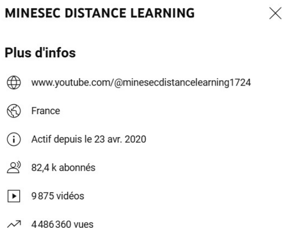
Figure 1 du 03-04-2025, des informations sur la chaîne Youtube du MINESEC DISTANCE LEARNING

L'innovation technologique repose sur l'intégration des outils TIC dans les pratiques pédagogiques. Elle a pris la dénomination de digitalisation et est instruite par la Ministre des enseignements secondaires depuis la pandémie jusqu'à ce jour. Si l'objectif premier de cette modalité était de combler le déficit lié à la limitation du temps scolaire du fait du confinement, par la suite, le modèle a été adopté pour désormais permettre d'être paré.e.s, afin de remédier aux éventuelles crises de l'éducation (dues à l'insécurité, aux catastrophes naturelles, ou aux pandémies). Cette instruction ministérielle est suivie de plusieurs actions : mise en place du centre d'éducation à distance, création de la chaîne Youtube du Distance learning où l'on retrouve des milliers de vidéos enregistrées ainsi qu'il apparaît sur la capture ci-après fournissant les informations sur la chaîne.