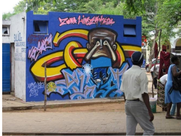
Ci-dessus commerce informel affichant ici la « zone libérée »