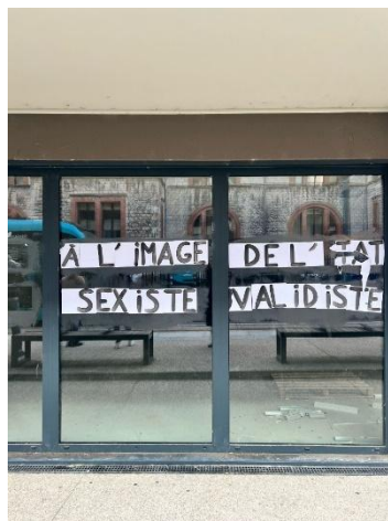
Arrêt de tram, Fontaine Ecu, Besançon

“A l’image de l’état sexiste valdiste” (Discours collé sur la paroi de verre alliant esthétique, intelligibilité et connotation rhétorique) ; “A nous de parler” (discours revendicatif écrit sur le mur) ; Sculpture représentant une femme à la posture combative, élégante et opulente.