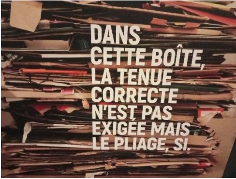
Poubelle de recyclage, ville de Besançon