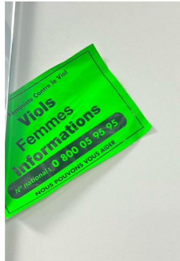
Toilettes, Fac de lettres.

“A l’image de l’état sexiste valdiste” (Discours collé sur la paroi de verre alliant esthétique, intelligibilité et connotation rhétorique) ; “A nous de parler” (discours revendicatif écrit sur le mur) ; Sculpture représentant une femme à la posture combative, élégante et opulente.