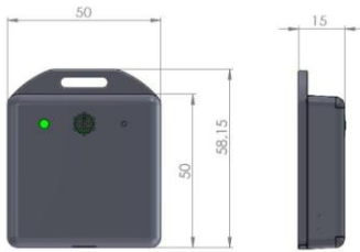
Figure 1 – Boîtier d'enregistrement des proximités et de la parole

En collaboration avec une entreprise implantée dans la région Auvergne-Rhône-Alpes, nous avons conçu des boîtiers mesurant 58,15 x 50 x 15 mm (hauteur x largeur x profondeur). Ces boîtiers, fixés au niveau du col à l'aide d'une pince bretelle et permettant d'enregistrer les proximités interindividuelles toutes les 5 secondes, intègrent également deux micros sur leur face avant (cf. Figure 1).