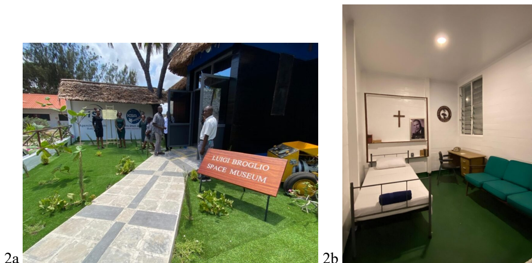
Figura 2a il Luigi Broglione Space Museum (Kenya);

Broglione. La scelta di posizionarla vicino all'Equatore, al largo del Kenya, era strategica: garantiva una maggiore spinta al lancio e semplificava il tracciamento dei satelliti. Questa impresa segnò una pietra miliare per l'Italia, che dimostrò di poter operare autonomamente nel settore spaziale. Tra il 1964 e il 1988, il programma San Marco proseguì con il lancio di altri quattro satelliti della serie (fino al San Marco V) e cinque satelliti astronomici della NASA. Per la prima volta nella sua storia, la NASA affidò il lancio dei propri satelliti a un'altra nazione, segno della fiducia nel gruppo guidato da Broglione. In cambio, la NASA ricevette preziosi dati scientifici raccolti dai satelliti italiani e fornì il razzo Scout per i lanci. Questa collaborazione rappresentò un momento d'oro per l'ingegneria e la scienza italiane, mostrando al mondo come una nazione, con visione e competenza, potesse raggiungere traguardi straordinari nello spazio. Tuttavia, il progetto San Marco, che vantava un tasso di successo superiore a quello della NASA, incontrò ostacoli politici e pressioni internazionali, specialmente da parte di altri paesi europei, interessati a sfruttare il know-how italiano.