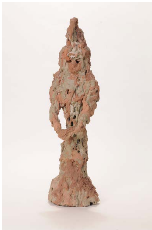
Johé Gormand, Dulcinée (hacia 1970). Cemento coloreado y hierro, 67 x 19 cm. Mâcon, Museo de las Ursulinas.

Como se puede ver, las artes plásticas francesas le dedicaron poca atención a la figura de Dulcinea, y las escasas creaciones de los siglos XX-XXI la representan desde un enfoque que, al fin y al cabo, es el mismo que en Cervantes, es decir, una figura concepto de lo bello y bueno.