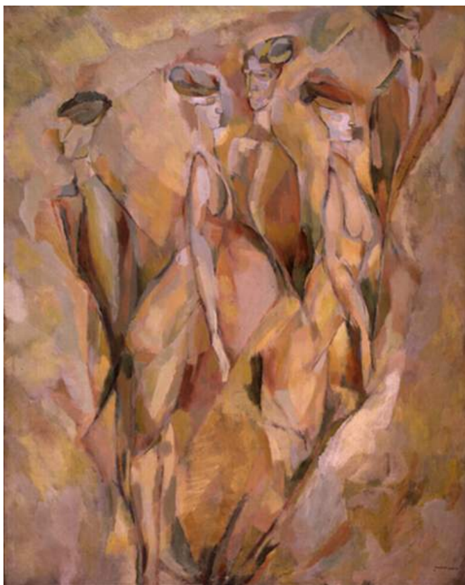
Marcel Duchamp, Portrait de Dulcinée (1911). Óleo sobre lienzo, 146 x 114 cm. París, Museo Marcel Duchamp.

Por cierto, en las artes visuales conocemos el Retrato de Dulcinea pintado por Marcel Duchamp en 1911, un óleo sobre lienzo de 146 x 114 cm. Curiosamente, el punto de arranque del cuadro no es el texto de Cervantes, sino una chica con la que se cruzó por una calle de Neuilly, quien le impactó emocionalmente, y de la que creó cinco vistas distintas en un solo y mismo retrato, casi cinético, pues se mueve por el óleo, como desnudándose, algo como «una visión simultaneísta de un desnudamiento en cinco momentos», en palabras de Octavio Paz 2 .