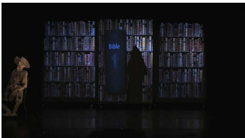
Dulcinea Langfelder, La Complainte de Dulcinée (2008).

paleta intermedial los recursos más tecnológicos, como son los dispositivos de proyección en pantalla.