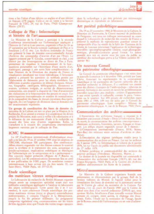
Culture et Recherche n° 0, p. 3.

Pour le numéro 147, 136 pages, on découvre un dialogue permanent entre texte et image, un thème unique décliné tout au long du numéro (« Recherche et intelligence artificielle »), selon un plan fortement structuré en parties et sous-parties. La liste des membres du comité éditorial occupe toute la dernière page, le directeur de la publication est le directeur de cabinet de la ministre de la Culture, et Noël Corbin, délégué général à la transmission, aux territoires et à la démocratie culturelle signe l'éditorial. Le texte de présentation de la revue, au revers de la quatrième de couverture, insiste sur la « diffusion » et la volonté de « rendre visible la recherche culturelle ». Bien entendu, cette version imprimée n'est désormais