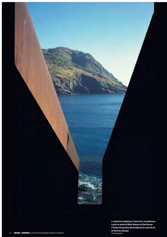
L'architecture requiert par l'avant d'Art. Conception de l'architecte italien Walter Segno et de son atelier à Paris. (Programme pluridisciplinaire de recherche Art, architecture, paysage).