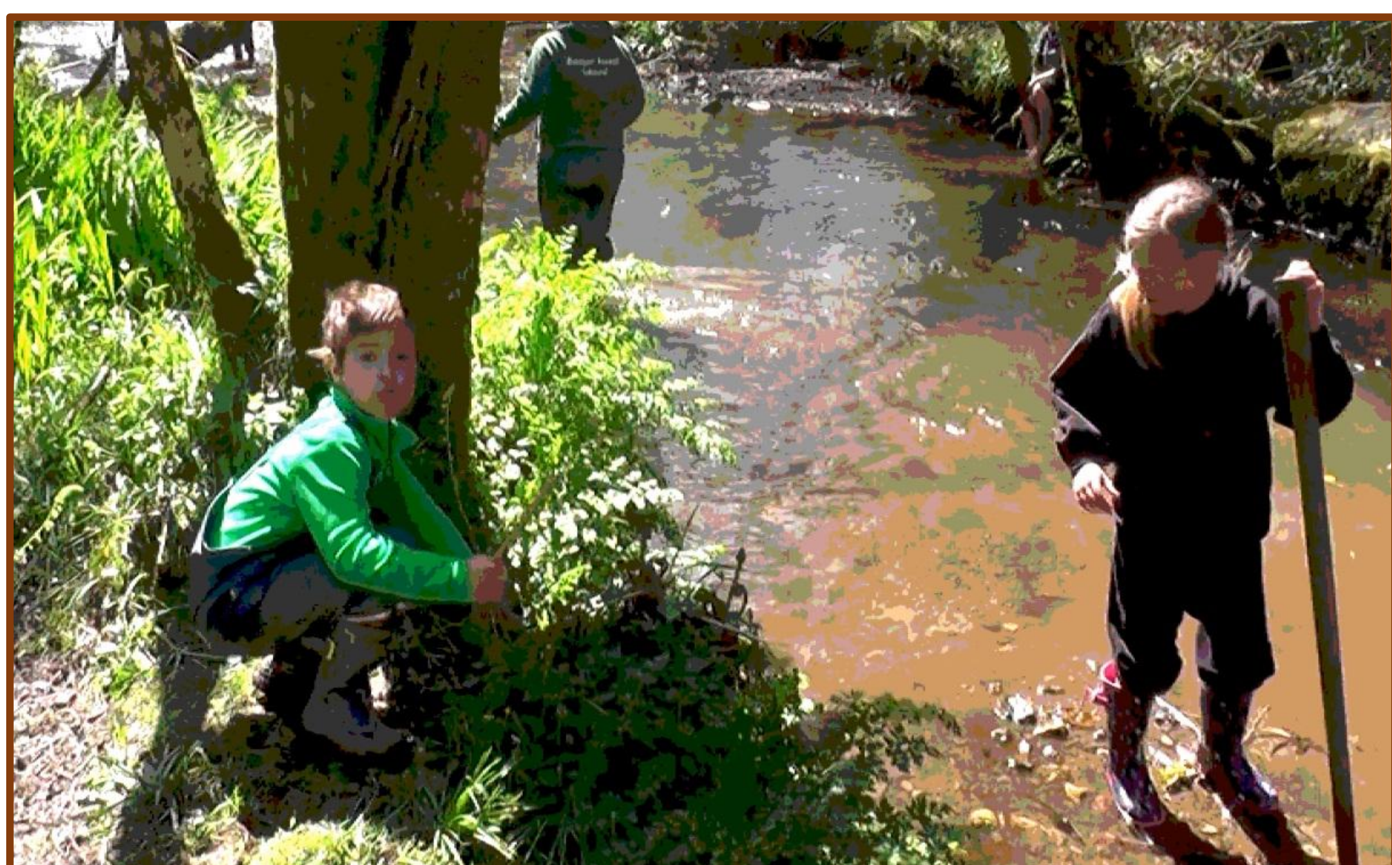
S'intéresser à de la cigüe (T5) – rapports affectif et cognitif

Le logos contient 158 technologies différentes, liées à 8 disciplines scientifiques et à des objets de savoirs. Il constitue la validité scientifique des techniques utilisées, et rassemble des savoirs scientifiques qui pourraient être mobilisés par les enfants.