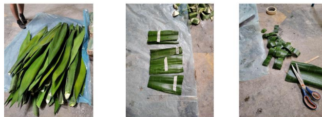
Figure 2 – préparation des feuilles de choca

(cf. Figure 2). En effet, ces parties ne contiennent pas de fibres et rendent plus difficiles l'étape du défibrage. Ensuite, des entailles transversales sont réalisées au niveau de l'épiderme tous les 3 cm afin de rendre plus efficace le rouissage.