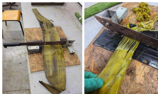
Figure 3 – défibrage des feuilles de choca

Après le rouissage, les fibres sont extraites des feuilles en raclant les feuilles à l'aide d'une machette (cf. Figure 3). La facilité du défibrage sera notée de 0 à 5, en prenant comme référence une feuille fraîche. Ainsi, 0 correspond à la même difficulté qu'une feuille non rouie, 1 à une feuille ramollie mais avec un épiderme non détachable, 2 à une feuille avec de grosses irrégularités dans la décomposition, 3 à un défibrage possible avec force mais avec emmêlement des fibres lors du processus, 4 à un défibrage facile mais avec quelques points de difficulté (ex. : craquelures sèches, grains...) et enfin 5 si aucune force physique n'est nécessaire.