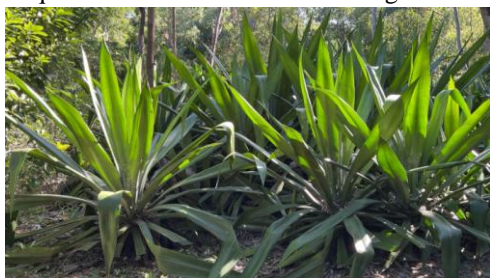
Figure 1 – plants de choca

Pour cette étude, 52 feuilles de choca ont été prélevées dans la forêt de l'Étang Salé à 45 m d'altitude. Le rang de la couronne de feuilles est relevé. Le rang 1 étant la base du plant au niveau du sol. L'angle entre la feuille et l'axe vertical, l'orientation de la feuille, et le caractère périphérique ou central de la feuille sont également notés.