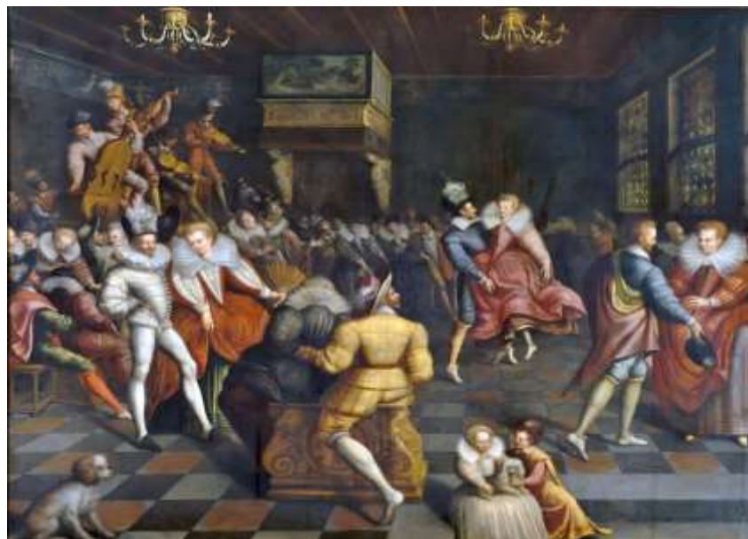
Anonyme, Bal à la cour des Valois (1580), Rennes, Musée des Beaux-Arts.

Sur cette image, on observe une sorte de cloche retournée, fêlée et débordant de soupe, où nagent mitres et crosses. Cette marmite de la vengeance bout sur un feu alimenté par le corps de trois martyrs réformés. Les catholiques tentent de maintenir d'aplomb la marmite de leur parti, mais, surgie du ciel, la Vérité armée du glaive des saints Évangiles renverse le tout. Il aurait fallu, selon Léry, ajouter à ce portrait burlesque de Villegagnon les attributs du fol, à savoir cette robe bariolée en sus de la croix et du flageolet (qui d'après Frank Lestingant apparaissent dans une autre gravure 15 ). On posera ici une pierre d'attente vers le deuxième mouvement de notre article, puisque Léry souligne par là même la lacune essentielle de la gravure en noir et blanc : ne pouvoir reproduire la diversité des couleurs ni rendre compte de la folie délétère de Villegagnon.