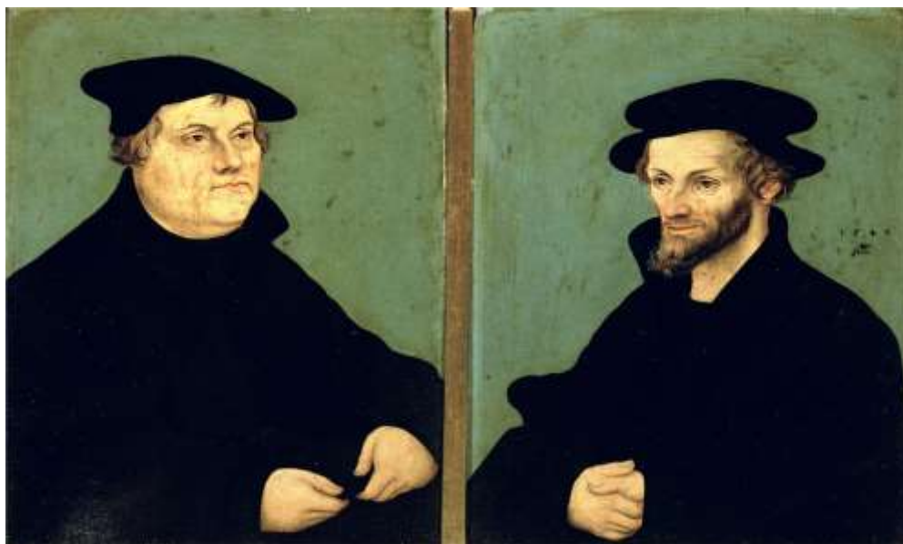
Lucas Cranach l'Ancien, Portrait de Luther et de Melancthon (1543), Florence, Galerie des Offices.