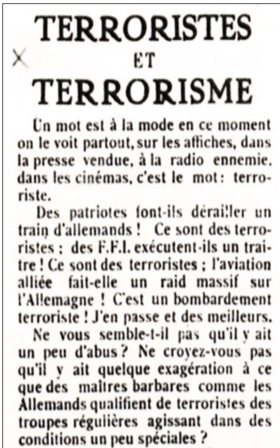
Figure 3. Le Patriote 1944, n° 21.