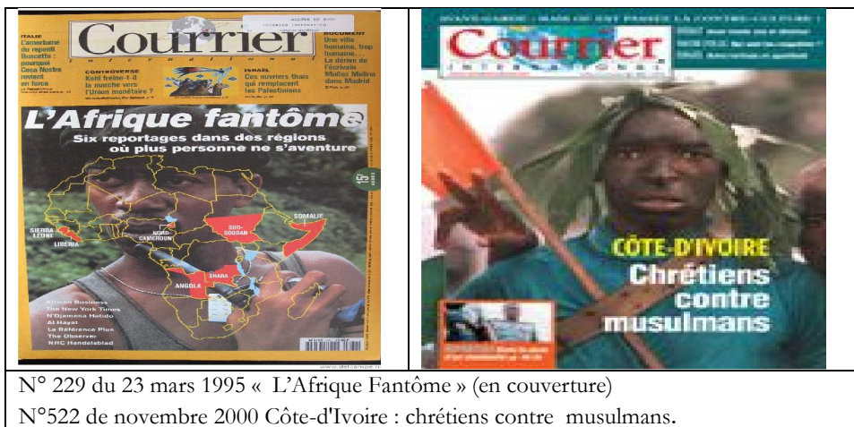
N° 229 du 23 mars 1995 « L'Afrique Fantôme » (en couverture)

Sur ces quinze titres, dix sont consacrés à des images de guerres. Nous en présentons deux ici sous le titre de « L'Afrique fantôme » et « la Côte d'Ivoire, chrétiens contre musulmans ».