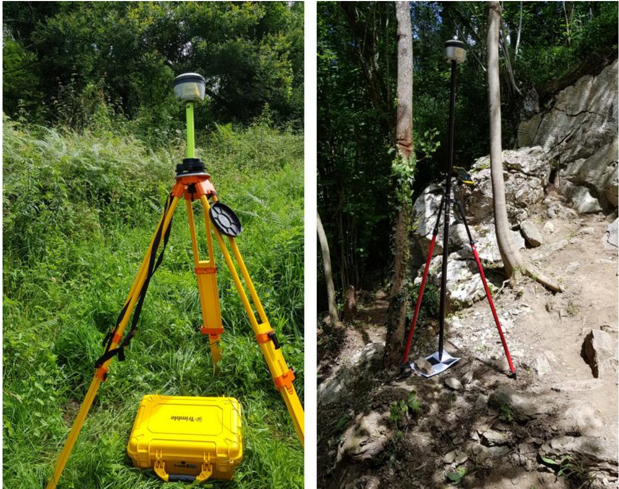
Figure 2 : A gauche le GPS en mode « base » sur trépied Lourd et à droite le « mobile » en phase d'acquisition sur tripode léger

Ce levé topographique a été réalisé avec deux GPS Trimble R2. Ces appareils ont été utilisés en mode « base-mobile » avec post traitement. Cela consiste à mettre en acquisition un des GPS sur un trépied lourd pendant toute la durée de la mission dans une zone dégagée, ce GPS sera considéré comme la base (Figure 2), et d'utiliser l'autre GPS pour mesurer les points, c'est le mobile.