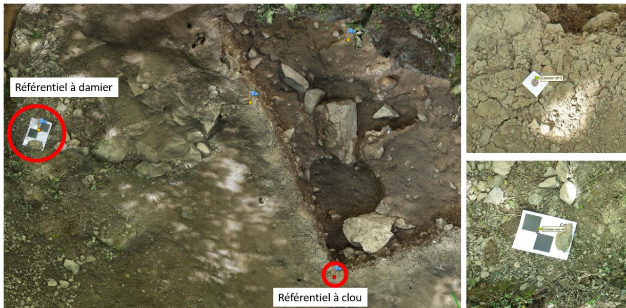
Figure 3 : Différents points de références autour de la fouille.

Les points existants du référentiel local, nommés Colome-ref-X sont des clous enfoncés dans le sol avec un papier pour les signaler. Les damiers servants au calage photogrammétrique/lasergrammétrique sont nommés « Colome-croix-X ». Pour chacun de ces points, un levé de 3 minutes, soit 180 époques a été réalisé ( Erreur ! Source du renvoi introuvable. ).