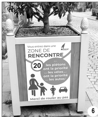
Figure 1. Les panneaux avec marquage de l'injonction