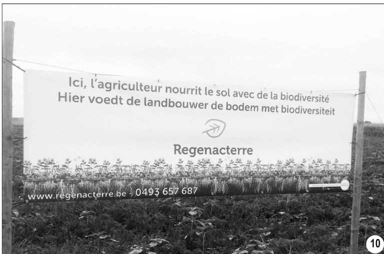
Figure 2. Les panneaux avec information injonctive sans marquage