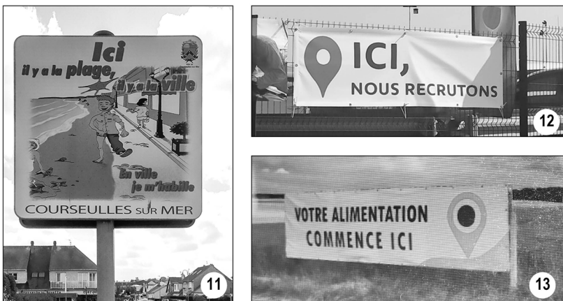
Figure 3. Les panneaux sans marquage, avec injonction implicite par un jeu d'oppositions

Les exemples (11) à (13) ont été classés en fonction de l'intentionnalité de l'information injonctive et selon la gradation d'une injonction de plus en plus implicite. Cette implication s'appuie sur un jeu d'oppositions de différents ordres (fig. 3).