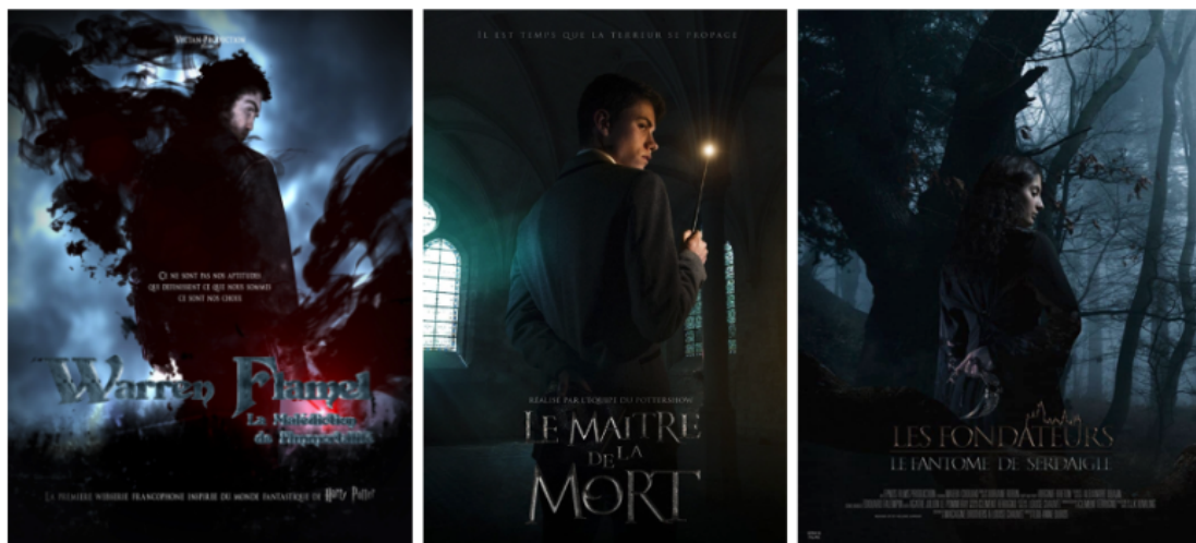
Affiches de la série de fanfilms non officiels Warren Flamel , Le Maître de la Mort et Les Fondateurs .