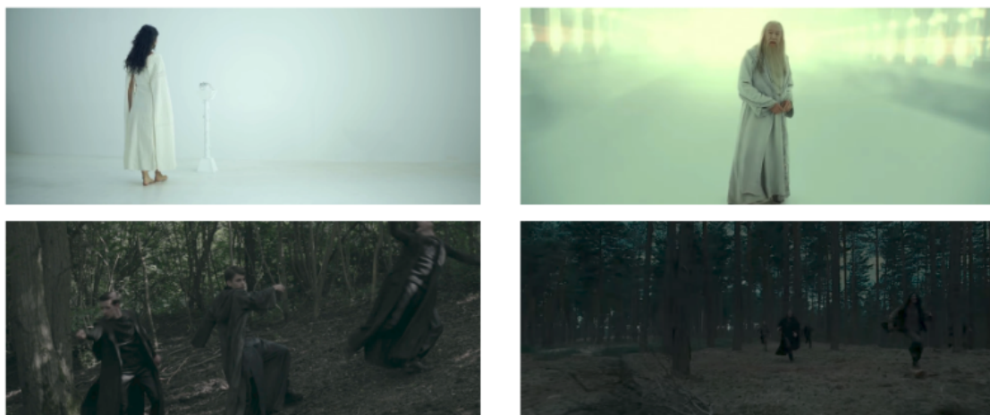
Comparaison entre la photographie des fanfilms (colonne de gauche) et Le Prince de sang mêlé (colonne de droite).