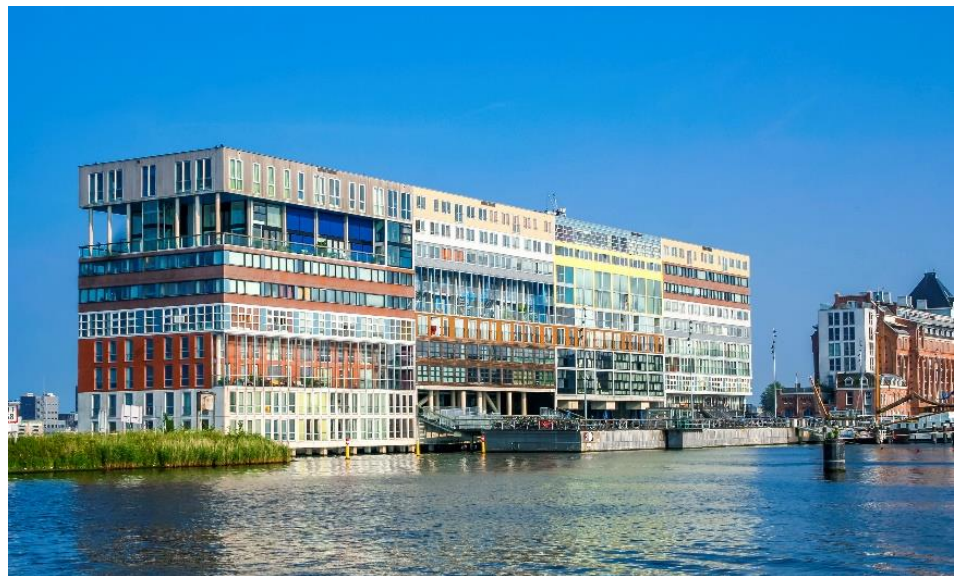
Immeuble Silodam à Amsterdam / Architecte : MVRDV

d'immense ruche composite dans laquelle peuvent s'installer les trajectoires et les temporalités de vie les plus diverses, entremêlées les unes dans les autres. Vu de l'extérieur, cette ruche hébergeant toute la diversité sociale de la ville-port d'Amsterdam revêt paradoxalement la forme d'un parallélépipède parfait flottant dans les eaux du Canal de la Mer du Nord réussissant ainsi le miracle d'une totalité fragmentaire. Magnifique vaisseau en partance sur les mers autant que monument social phalanstérien ancré au territoire, il incarne le mouvement immobile de l'architecture autant que le présent épais de la vie quotidienne, le jour comme la nuit. L'ancien quai réactive également la mémoire identitaire des temporalités portuaires du passé colonial.