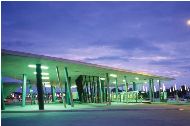
Station multimodale Hoenheim Nord à Strasbourg / Architecte : Zaha Hadid

explorer plus particulièrement l'exemple du terminus de la station multimodale de Hoenheim Nord à Strasbourg, construit en 2001 par Zaha Hadid. Le projet consiste en la superposition « de champs et de lignes » qui s'entrelacent pour former un tout en mouvement constant, donc très instable. Ces « champs » sont matérialisés par le dessin des mouvements et des trajectoires engendrés par les voitures, les trams, les bicyclettes, les piétons. Ce sont les signes du langage spécifique de chacun de ces « mobiles » - lignes blanches de marquage au sol de circulation et de stationnement, enrobés routiers de voirie, lampadaires urbains, etc ... - qui en construisent le paysage dynamique. Paysage ouvert dans le temps aux mouvements et aux temporalités de chacun des protagonistes quotidiens de la plateforme multimodale, devenue nouvel espace public majeur réellement pratiqué du monde contemporain. Paysage-mouvement donc qui n'existe qu'en présence de ses protagonistes en mouvement plutôt qu'espace volume défini par ses limites et ses faces qui se contente de contenir ses utilisateurs y compris lorsqu'ils ne sont plus là.