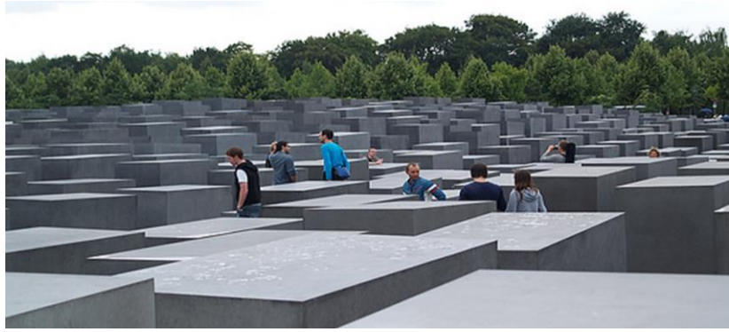
Memorial Juif de Berlin / Architecte : Peter Eisenman

Dans les années 60, au-delà de sa dimension primitive et phénoménologique que l'on vient d'évoquer, le rythme, dans sa présence quotidienne et sous forme de « rythmanalyse » apparaît aux yeux du sociologue Henri Lefebvre comme interface entre les temporalités cycliques rurales et les temporalités linéaires de l'industrie. Plus précisément, « La rythmanalyse étudie les interférences entre le temps cyclique (naturel, irrationnel en un sens, encore concret) et le temps linéaire (acquis, rationnel, abstrait en un sens et anti-naturel. Elle examine les déficiences et maladies qui résultent de cette interaction encore peu et mal connue. Elle envisage enfin les métamorphoses possibles du fait de cette interaction, dans la quotidienneté » (Lefebvre, 1961, p.61). La rythmanalyse, pionnière des connaissances sociale, n'aura pas grand effet sur l'architecture de l'époque, en fin de modernité mais elle sera réactivée bien plus tard pour expertiser la complexité temporelle.