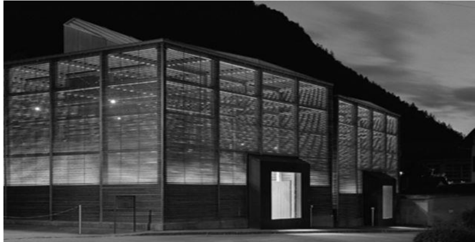
Musée Archéologique de Chur / Architecte : Peter Zumthor