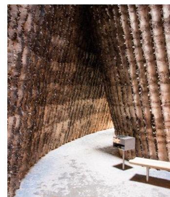
Chapelle des Frères Klaus Field à Eiffel / Architecte Peter Zumthor