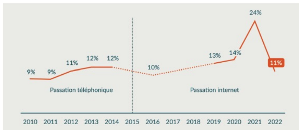
Figure 2 : Évolution de la part des personnes isolées en fonction du niveau de revenu