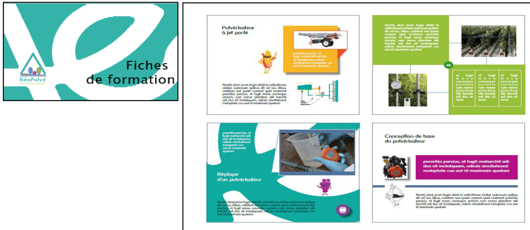
Figure 2: Exemple d'illustration des modules de formation Néopulvé Figure 2: Examples of graphic design applied to Neopulvé modules

secteur de production concerné : grandes cultures : marron clair ; viticulture : pourpre ; arboriculture : vert. Par ailleurs, différents pictogrammes permettent d'insister sur les points importants (Figure 2).