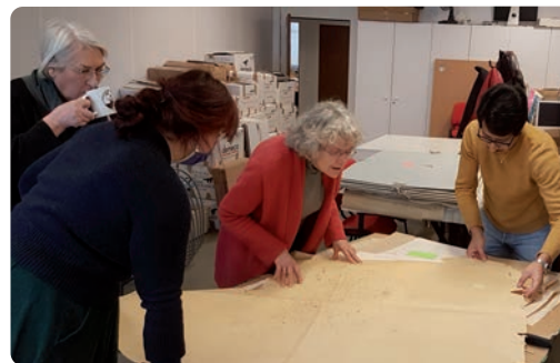
Inventaire des plans à la MSH Mondes, février 2023