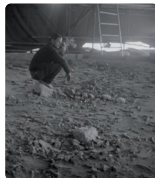
A. Leroi-Gourhan sur le sol de l'habitation n° 1, 1964

En structuraliste, A. Leroi-Gourhan cherche à démontrer la contemporanéité des vestiges d'un sol archéologique. La structuration spatiale des activités humaines devait exprimer des régularités, modélisables aussi bien sur les sols d'habitat que sur les parois des grottes ornées. Les preuves de la contemporanéité des ensembles empruntèrent les voies des remontages des silex taillés et des pierres de foyers 2 , puis la mise au point de la méthode des empreintes stratigraphiques au latex 3 .