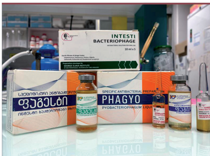
Figure 2. Préparations commerciales de phages thérapeutiques, Tbilisi, Georgie.

montrent combien les phages sont susceptibles d'exercer une influence non négligeable sur les populations bactériennes en alternant cycle lytique, cycle lysogénique et infection chronique, qui produit des phages mais sans pour cela détruire la cellule. Par ailleurs, d'autres pistes, comme le processus de transduction qui permet le transfert de matériel génétique d'une bactérie donneuse à une bactérie receveuse par l'intermédiaire d'un phage, sont étudiées. En effet, les phages favorisent le transfert horizontal de gènes entre bactéries [4]. La lysogénie, quant à elle, peut favoriser la formation de vésicules membranaires et permettre certains échanges de molécules entre bactéries [36]. Enfin, les phages seraient capables d'inhiber la réponse immunitaire locale ainsi que les réactions inflammatoires [37]. Toutes ces situations participent à l'homéostasie des microbiotes.