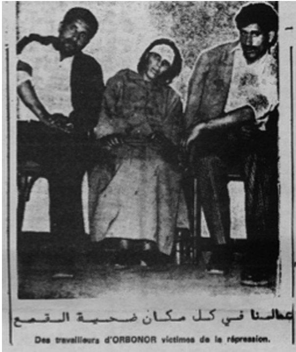
Figure 6 : Photographie de victimes de la répression au Maroc, Al Jaliya Al Maghribiya , juin 1972.

La première catégorie fournit des données pratiques, à valeur immédiate, portant sur la vie quotidienne des immigrés et qui ont pour objectifs d'encadrer et d'orienter ces derniers. L'exemple typique pour illustrer cette catégorie est celui des thématiques traitées dans la rubrique « Guide de l'immigré » publiée dans Al Jaliya . Cette rubrique propose par exemple aux immigrés des fiches pratiques des démarches à suivre lors d'un contrôle policier conduisant à une expulsion, ou bien des fiches inventoriant les différents articles de lois françaises qui régulent le phénomène de l'immigration, etc.