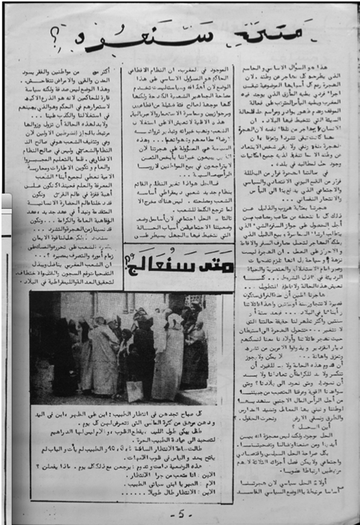
Figure 8 : Article 35 publié dans Al Jaliya Al Maghribiya , janvier 1972.

révolutionnaire » (n° 1, 1984), « Caractéristiques de la féodalité au Maroc » (n° 8, 1976), etc. Une rhétorique de l'instruction qui « reprend un modèle scolaire de type dissertatif, avec une mise en relief des définitions préliminaires, de grands panoramas historiques » 36 , y est mobilisée. Pour le public de militants assez