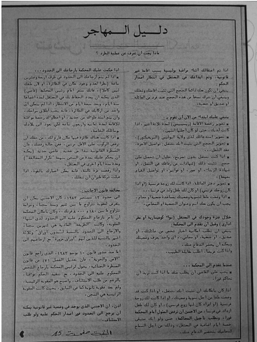
Figure 7 : Rubrique intitulée « Guide de l’immigré », Al Jaliya Al Maghribiya , n° 27, 1984.

La quatrième et dernière catégorie englobe des articles d’analyse théorique. Il est possible d’en distinguer deux procédés distincts en fonction du public ciblé. Les articles s’adressant au public des « nouveaux militants » prennent un format relativement court, souvent sous forme d’encadrés. C’est le cas par exemple de la rubrique « Guide du militant » d’ Option révolutionnaire où une variété de thématiques politiques est analysée, comme « Un exposé facile du lexique