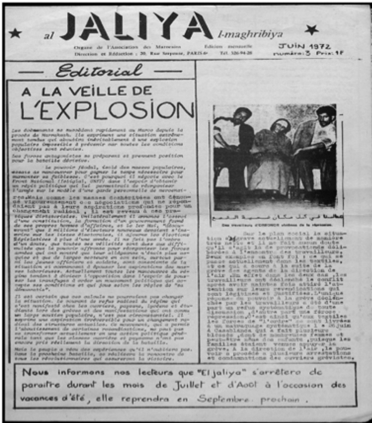
Figure 3 : La Une du numéro de juin 1972 d'Al Jaliya Al Maghribiya.

La maquette et la mise en page sont réduites au strict minimum. Les pratiques artisanales de collage des coupures d'articles issus d'autres titres de presse, les dessins manuscrits de graphiques et de courbes, la non-permanence du nombre de colonnes d'un espace-page à un autre sont quelques illustrations de l'aspect technique rudimentaire d'Al Jaliya.