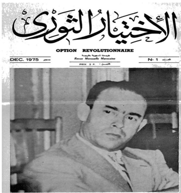
Figure 1 : La Une du n° 1 d'Option révolutionnaire, paru en décembre 1975.

d'un mouvement éponyme rassemblant un collectif d'anciens militants de l'Union nationale des forces populaires (UNFP). La publication s'inscrit pleinement dans le sillage de l'héritage et des réflexions du leader politique marocain Mehdi Ben Barka. D'ailleurs, le titre Option révolutionnaire fait référence à celui d'un manifeste rédigé et lu par Mehdi Ben Barka lors du 2 e Congrès de l'UNFP tenu en 1962. Dès son premier numéro, les auteurs-éditeurs de cette publication affichent explicitement leur appartenance et affiliation idéologique 24 .