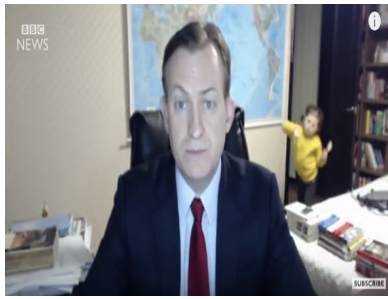
Fig.5 : BBC Dad famille au complet

bien comment il articule ordre / désordre, public / privé, sérieux / ludique et même masculin/ féminin ou occidental / asiatique puisqu'une polémique est née sur l'interprétation donnée à la présence de la jeune femme coréenne, perçue par beaucoup comme la nounou, et en réalité épouse, fort diplômée, du « BBC Dad » et qu'une parodie professionnelle a mis en scène une « BBC Mum » et partant la question des genres et des tâches domestiques.