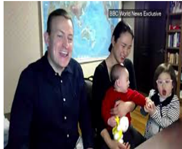
Figure 6 « BBC Dad », la