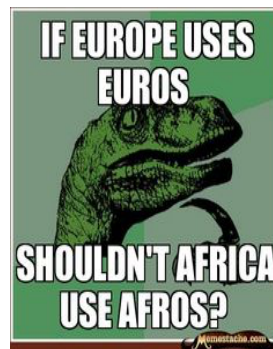
Fig. 4 : idem

Il s'agit donc d'une sorte d'exercice de style qui consiste à s'inscrire dans une forme prédéterminée en la modulant suffisamment pour la renouveler, tout en assurant un degré de conformité suffisant par rapport au prototype pour permettre sa reconnaissance. Le phénomène des mèmes instaure un défi à la créativité individuelle, sur fond de rivalité : chaque énonciation vient à la fois renouveler et renforcer le mème comme forme de la praxis énonciative.