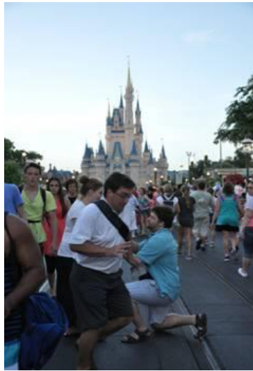
Fig. 1 : séquence initiale du mème "In The Way Guy

important, puisque l'internaute redessine lui-même le personnage de « ITWG » pour l'intégrer dans la représentation d'une œuvre culturelle. La création des variantes et leur diffusion se concentrent sur la fin du mois de juillet 2013.