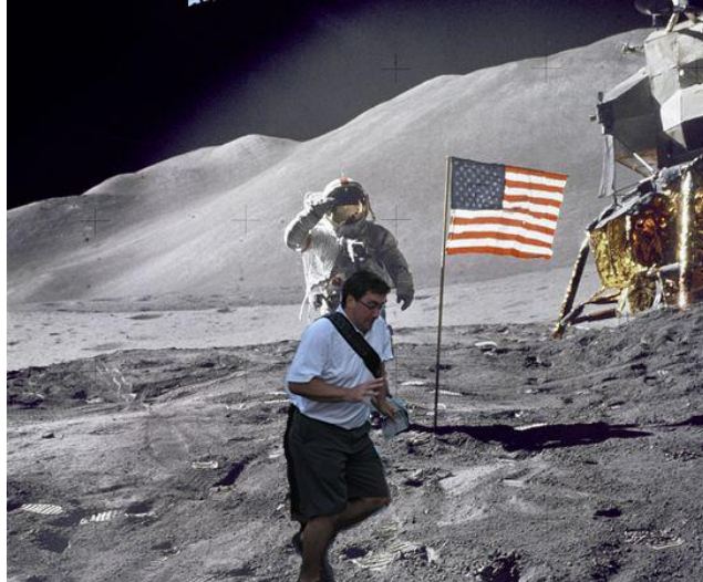
Fig. 2 : occurrence de variation

La matérialité même du média numérique, avec sa transformabilité, rend possibles la création et la diffusion des mèmes, et nous reviendrons sur ce point. Si le format d'accueil le plus répandu semble être l'image fixe, les mèmes utilisent également deux autres formats numériques. La technique du gif animé, ou séquence d'image animée qui se répète, très répandue dans la culture numérique, a donné naissance à de nombreux mèmes. Citons à titre d'exemple le mème connu sous le nom de « Scarlett Johansson Falling Down », dans lequel on voit l'actrice faire une chute dans la rue lors d'un tournage à Glasgow en octobre 2012. En septembre 2013 l'image du gif animé de cette scène est publiée sur la plateforme Reddit, puis reprise dans d'innombrables variantes au cours du même mois 9 . L'image de l'actrice en train de chuter est ainsi insérée dans de multiples scènes représentatives de la culture de masse. Des compilations de variantes sont rassemblées notamment sur un tumblr 10 .