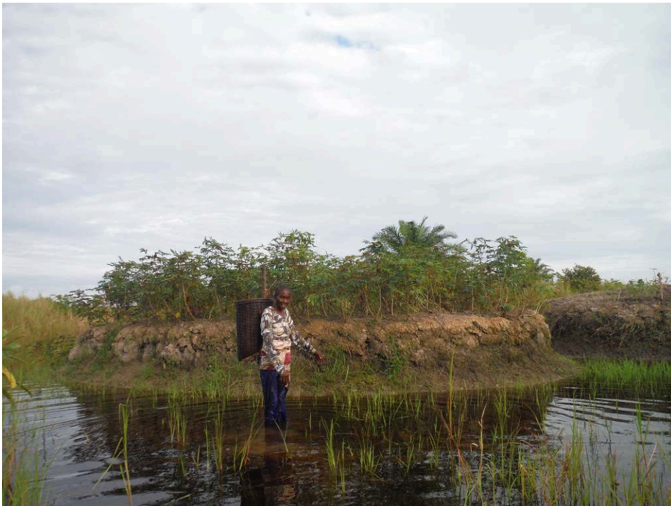
Fig. 3. Un champ surélevé actuellement cultivé, planté avec du manioc. Mossaka, République du Congo, dans la cuvette centrale du bassin du Congo.

coupent des mottes d'herbes et des couches superficielles du sol de l'espace autour de chaque champ puis les accumulent au-dessus, produisant ainsi une surface surélevée et des sols bien drainés auxquels les nutriments sont apportés par la décomposition de la matière organique. De nouvelles couches de matières sont ajoutées après chaque période de jachère (pour les détails, cf. Rodrigues et al. 2020). Motivées au début par notre intérêt pour les champs surélevés amazoniens, ces études ont vite révélé des systèmes d'agriculture intéressants en eux-mêmes mais complètement méconnus des écologues, des anthropologues, des agronomes et, a fortiori des décideurs politiques (Comptour et al. 2018). Au lieu de tenter de réhabiliter l'agriculture sur champs surélevés là où elle a disparu, il est peut-être plus prometteur de mieux comprendre son fonctionnement et sa contribution potentielle à la résilience, là où elle est encore pratiquée, l'archéologie ayant un rôle à jouer dans cette entreprise interdisciplinaire. Des vestiges archéologiques de champs surélevés ont été découverts au Gabon (Oslisly 2017) et en République du Congo (Comptour et al. 2018), mais, faute d'études, on ignore leur connexion avec les champs surélevés actuels. Tout est à faire. L'enjeu sera de naviguer entre les périls pour bien découvrir les plaisirs.