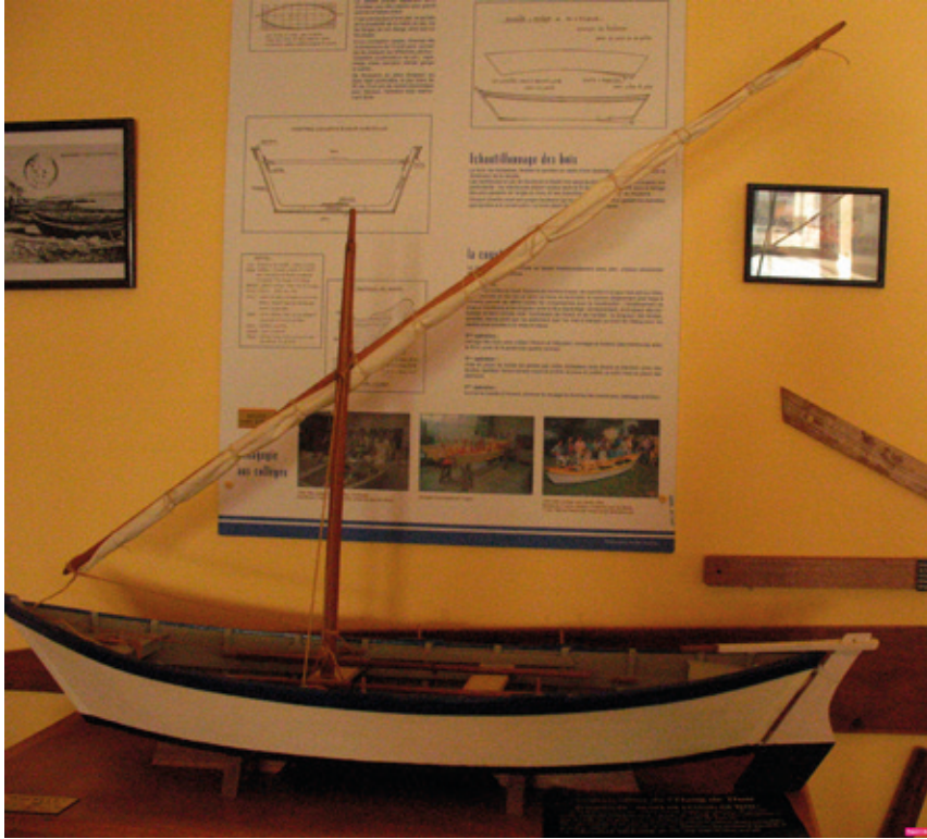
1. Maquette d'une barque de pêche à fond plat permettant de s'adapter à la géomorphologie et son panneaux explicatif, musée de l'Étang de Thau

Ambert. Certains des panneaux permettent une compréhension large des évolutions du paysage littoral depuis 25 000 ans. Néanmoins, ce musée est le seul à avoir mis en lumière les évolutions, sur le temps long, rappelant ainsi que cette côte est un espace fragile et mouvant 21 . Ce dernier point a pourtant une importance particulière pour la recherche en archéologie sous-marine et la conservation des biens culturels marins. Ainsi, en collaboration avec Benoît Devillers 22 , le musée de l'Éphèbe d'Agde va très prochainement interroger ces aspects environnementaux à travers des recherches géoarchéologiques et sédimentologiques menées depuis six ans dans la région.