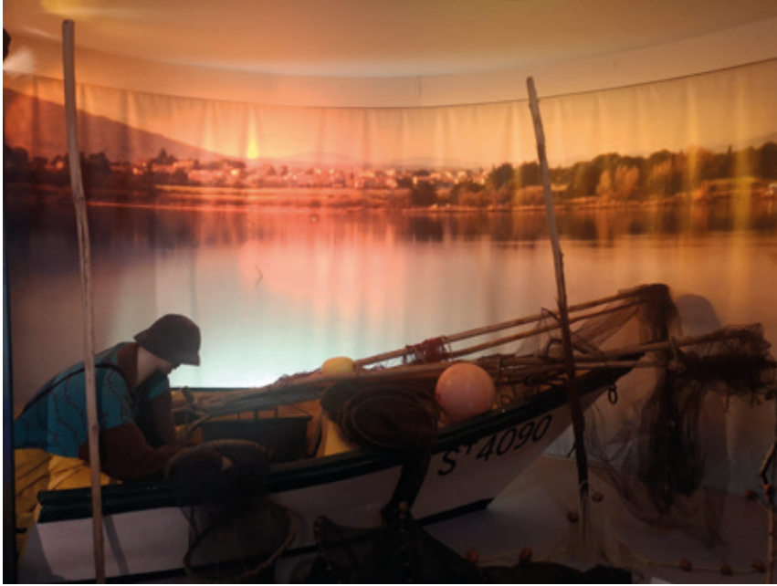
b. « La pêche à la capéchade, la journée du pêcheur », musée du Patrimoine Jean-Aristide Rudel. La pêche à la capéchade est une technique de pêche à l'anguille pratiquée en étang.

Les ex-voto présentés au sein du musée agathois Jules Baudou témoignent aussi du risque maritime. Le péril des naufrages encouru par les marins languedociens est décrit à travers des témoignages tant écrits que picturaux. Sur seize ex-voto exposés dans une salle dédiée, seulement deux relatent des difficultés rencontrées dans le golfe du Lion 28 : celui du capitaine S. Bacou de Dunkerque, en 1865, et celui du capitaine Charles Blanquefort de Marseille, en 1862 (fig. 4a).