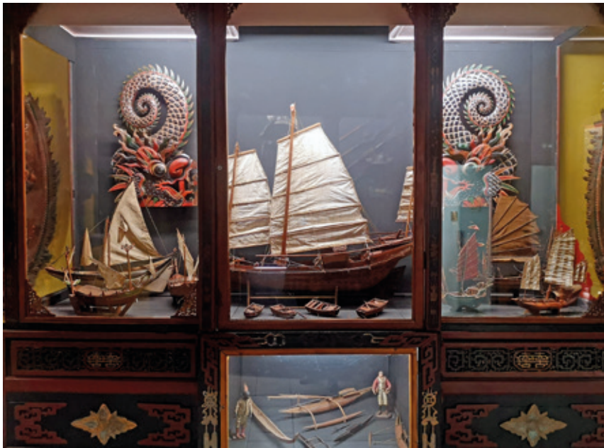
5. Composition complexe associant un mannequin costumé en soldat garde-côtes à un diorama montrant une redoute du xvii e siècle et des pêcheurs cabaniers que semble menacer un chébec maghrébin croisant au loin, musée du Patrimoine de Palavas