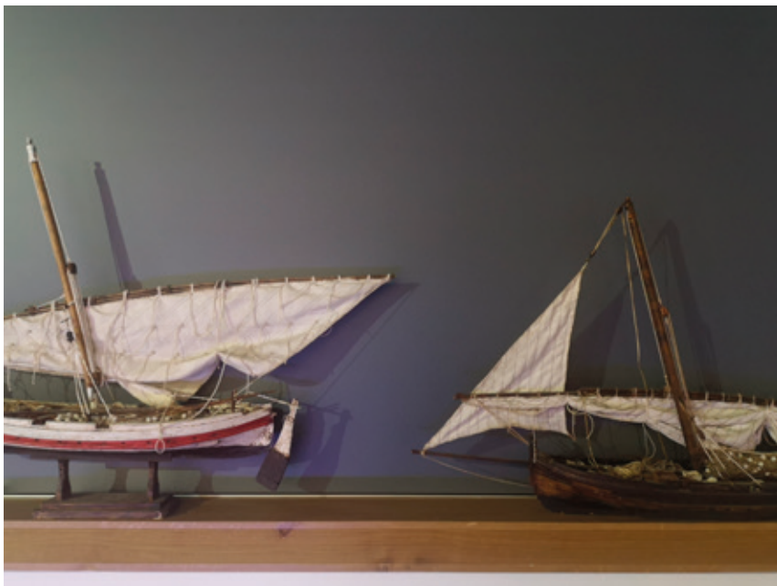
2. Maquettes de barques de pêche sans cartels, musée du Patrimoine Jean-Aristide Rudel

auxquelles les communautés littorales se sont pliées. Ainsi, des barques à fonds plats utilisées pour la pêche en mer ou sur les étangs, ou leurs maquettes, montrent l'adaptation du matériel aux fonds sableux et peu profonds de la côte et des lagunes (fig. 1 & 2).