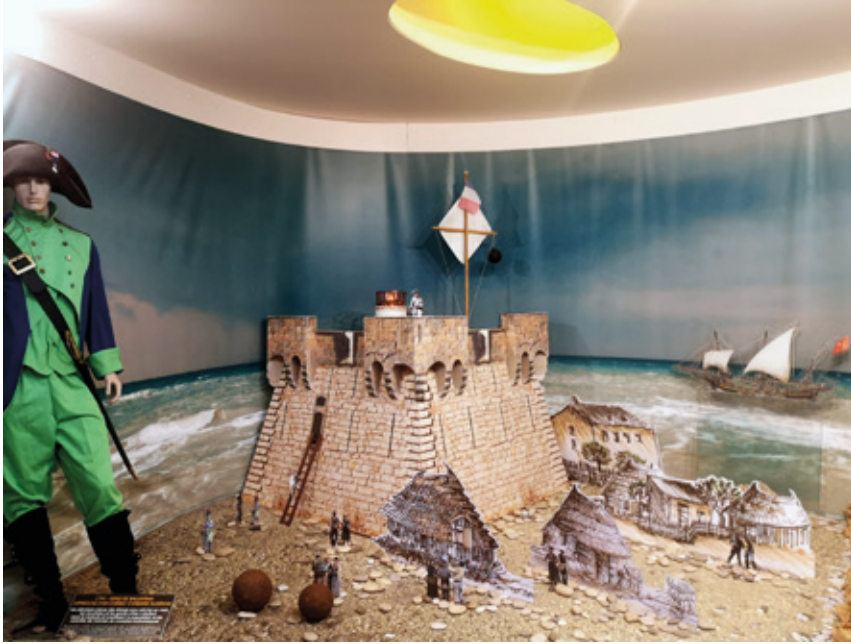
6. Vitrine provenant du pavillon du Cambodge lors de l'exposition coloniale de 1931. Ces objets collectés dans les années 1930 illustrent les liens humains et professionnels unissant certaines familles agathoises à l'Empire, Musée agathois Jules Baudou

comme aux Romains n'étonneraient guère au musée de l'Éphèbe et feraient écho à l'exposition, présentée au Musée archéologique Henri Prades (Lattes), consacrées aux relations entre colons phocéens et populations locales de l'actuel Languedoc 40 . Bien qu'il accorde une place importante à la période antique en montrant les civilisations méditerranéennes par le biais de tables interactives, le musée du Cap d'Agde est bien plus consacré au commerce maritime qu'aux colonisations grecque et romaine. Ses salles présentent des navires, leurs cargaisons et les pièces les plus spectaculaires qui ont été retrouvées par les archéologues.