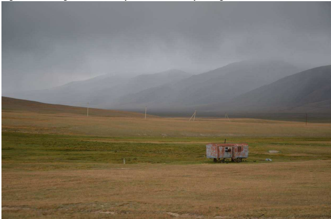
Figure 1 : Pâturage de Solton Sary, Province de Naryn, Kirghizistan.

Le Kirghizistan est un pays couvert à 90% de montagnes où plus de la moitié du territoire se situe au-dessus de 2 500m d'altitude. La population vit dans les zones rurales et dépend des activités d'élevage et d'agriculture. Les pâturages d'été sont des territoires convoités pour la nourriture du bétail. Le pâturage nommé Solton Sary est situé dans une haute vallée des Tian Chan, entre 2 700 à 3 300 mètres d'altitude, à l'est du Kirghizistan, dans la province de Naryn. Le climat continental extrême présente des variations de températures entre 25°C l'été et - 40°C en hiver. Les faibles précipitations (entre 200 et 300 mm par an) en font un territoire semi-aride. Le sol est couvert d'une pelouse alpine, utilisée par les habitants de plusieurs villages pour nourrir le bétail de mai à septembre. Les bergers du village d'Emgeçil n'hésitent pas à parcourir près de 100 km pour se rendre sur ce pâturage.