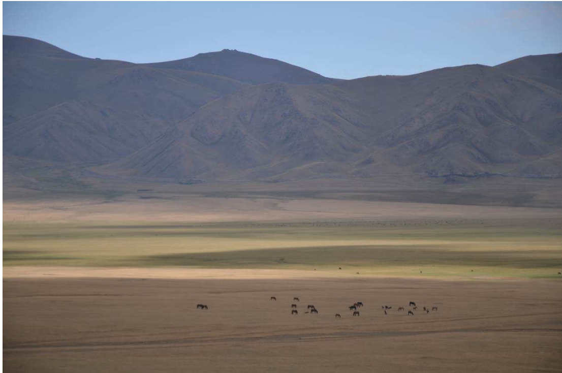
Figure 2 : Pâturage de Solton Sary, Province de Naryn, Kirghizistan.

Le début de l'automne avec le retour de la neige sur les hauteurs sonne la fin de la saison des hauts pâturages. A la descente, une partie des bêtes est vendue. Cette entrée d'argent est parfois la seule de l'année et doit couvrir toutes les dépenses : les frais de scolarisation des enfants, le prix de l'énergie (les villages sont électrifiés), l'habillement, etc. La vente de chèvres et de moutons se fait dans la ville-centre de la province, Naryn, alors que les bovins et les chevaux sont vendus dans le grand marché de Tokmok, à la frontière avec le Kazakhstan à près de 250 km du village.