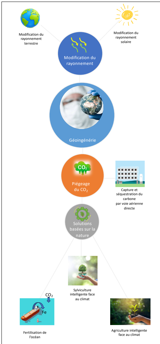
Figure 1: Diagram showing the main geoengineering techniques

carbone dans les écosystèmes nécessite, dans la plupart des cas, une gestion active de ces écosystèmes, qu'il s'agisse de forêts, de champs cultivés ou de prairies. La recherche insiste également sur le fait que les solutions fondées sur la nature doivent être conçues pour la longévité, compte tenu du potentiel de puits de carbone à long terme des écosystèmes terrestres. Nous présentons ci-après les principales solutions climatiques fondées sur la nature, avec toutefois une focale principale sur les écosystèmes terrestres. Certaines solutions climatiques fondées sur la nature peuvent être déployées sur les océans, ces solutions ne relevant pas de notre domaine d'expertise, nous ne les présentons pas dans cet article mais renvoyons aux synthèses déjà existantes (Riisager-Simonsen et al. , 2022 ; O'Leary et al. , 2023).