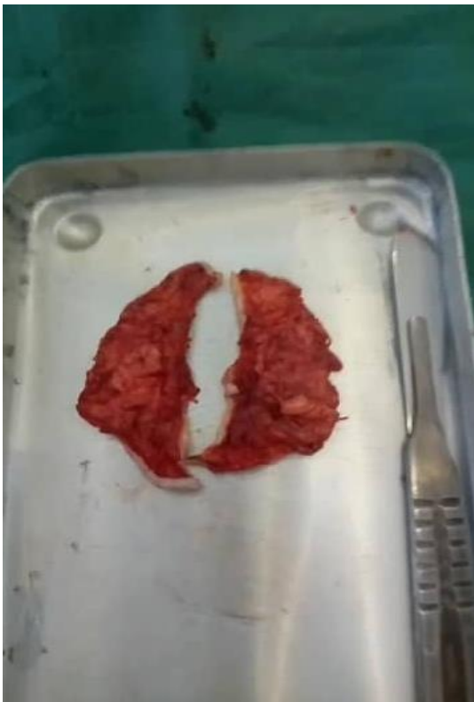
Figure 3 : Exérèse de lambeaux de peau.