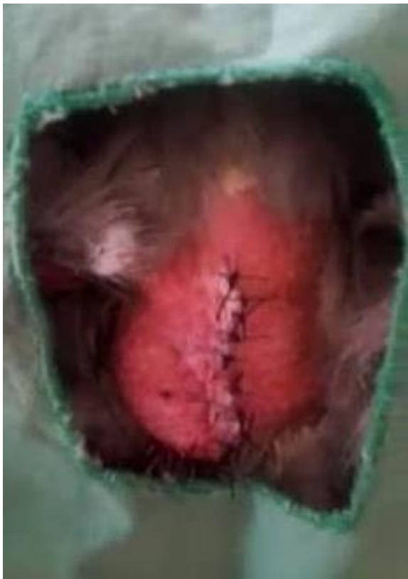
Figure 7 : Synthèse