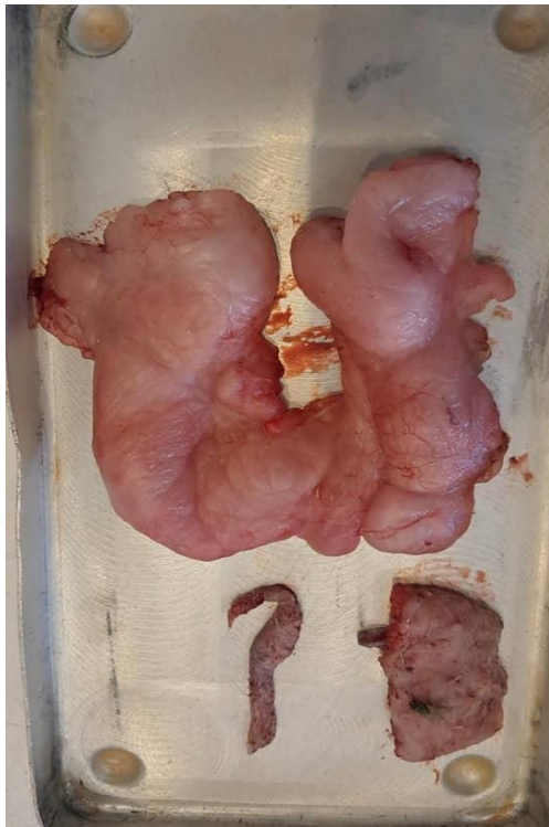
Figure 11 : La graisse retiré