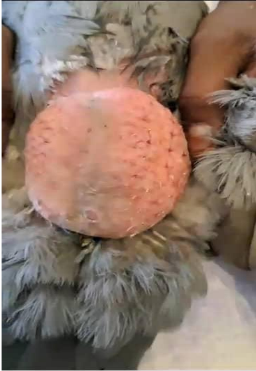
Figure 9 : Préparation du champ opératoire