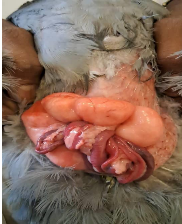
Figure 10 : La graisse intra abdominale