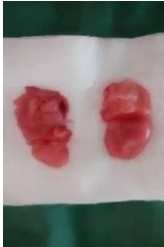
Figure 8 : Les deux boules retirées