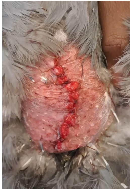
Figure 12 : Synthèse