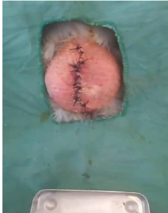
Figure 2 : Diérèse et synthèse de la peau