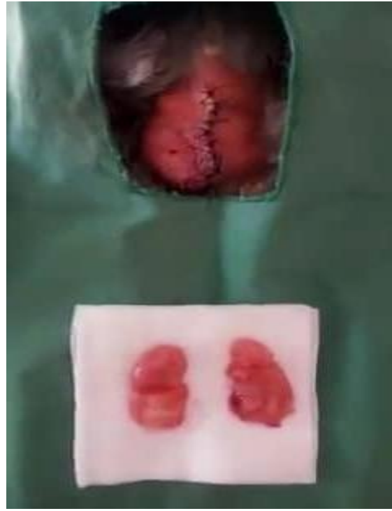
Figure 6 : Exérèse des deux boules