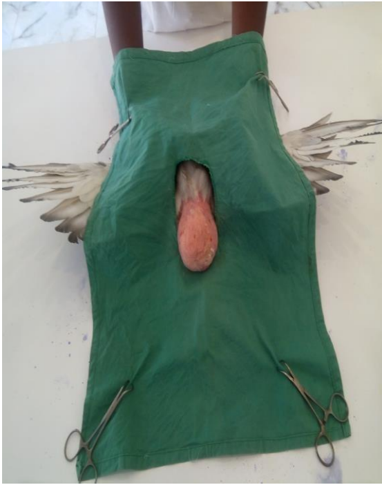
Figure 1 : Déplumage et contention du pigeon.