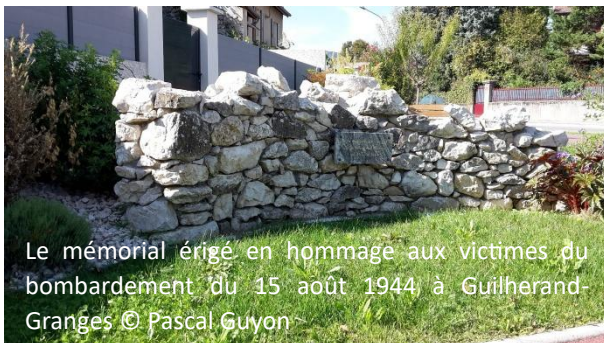
Le mémorial érigé en hommage aux victimes du bombardement du 15 août 1944 à Guilherand-Granges

La stèle érigée dans la cité bourguésanne représente les décombres d'un bâtiment, dans lesquelles un cylindre qui enferme le nom des victimes a été déposé. La plaque commémorative a connu deux versions. Celle de 1984 portait un texte assez court : « A la mémoire des 160 victimes connues et inconnues du bombardement aérien du 15 août 1944 ». Cette plaque a été brisée à la fin des années 1980. Elle a été remplacée, en 2013, et le libellé en a été modifié : « La ville de Bourg-Saint-Andéol/A la mémoire des victimes/Du bombardement du 15 août 1944 »/[Suivent les prénoms et noms des 146 victimes recensées] « trois enfants inconnus et victimes non identifiées et les blessés ». Elle est surmontée par une sculpture représentant les armes de la ville, dont la lame du cimier est symboliquement brisée, illustrant la coupure entre les deux rives du Rhône. Elle est l'œuvre des frères Roux.