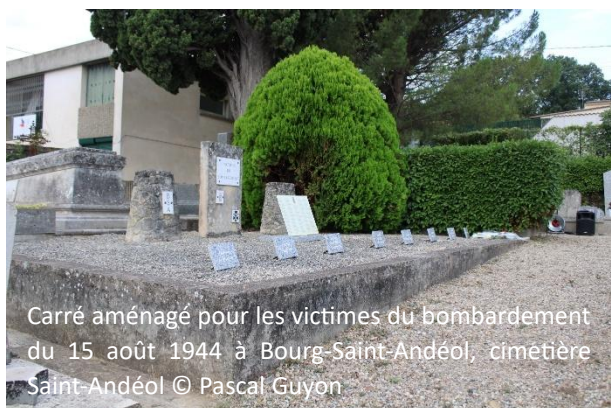
Carré aménagé pour les victimes du bombardement du 15 août 1944 à Bourg-Saint-Andéol, cimetière Saint-Andéol

« Victimes/du/bombardement ». Elle est accompagnée de deux autres plaques, plus petites, sur lesquelles sont gravées les armes de la ville et la croix de guerre. De part et d'autre de la stèle, ont été installés des plots de forme conique, dont la partie supérieure est tronquée. Chacun accueille une plaque en marbre blanc. On y lit, verticalement, « B.S.A. » et « 15 AOUT 1944 », respectivement à gauche et à droite. Toute la