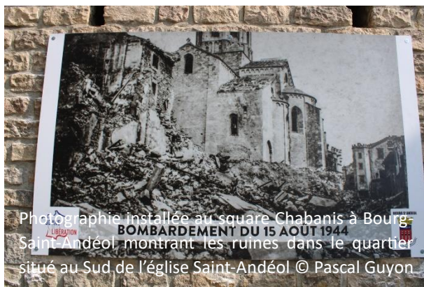
Photographie installée au square Chabanis à Bourg-Saint-Andéol montrant les ruines dans le quartier situé au Sud de l'église Saint-Andéol

La mise en tourisme des mémoires des bombardements est liée au 80 ème anniversaire des raids aériens alliés de l'année 1944.