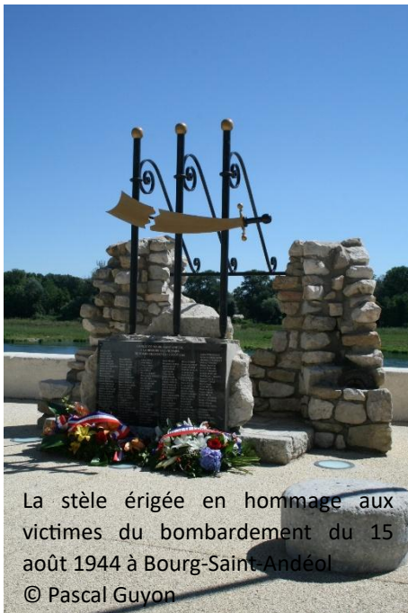
La stèle érigée en hommage aux victimes du bombardement du 15 août 1944 à Bourg-Saint-Andéol

La volonté de donner une dimension plus solennelle à la mémoire des victimes des bombardements est apparue tardivement en Ardèche. Il faut en effet attendre l'année 1984 pour qu'une stèle soit érigée à Bourg-Saint-Andéol, et 2014 pour qu'un mémorial soit inauguré à Guilherand-Granges et au Pouzin. Dans les trois cas, des lieux symboliques ont été choisis pour leur installation. Dans la cité bourguésanne, il s'agit de l'entrée de l'ancien pont suspendu ; à Guilherand-Granges, de l'endroit où des immeubles ont été détruits par des bombes ; au Pouzin, le monument fait face aux grottes où une partie de la population se réfugiait lors des bombardements. Les trois monuments se présentent sous des formes différentes, mais correspondent à une même thématique, celle des ruines, à Bourg-Saint-Andéol et à Guilherand-Granges.