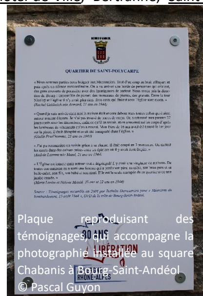
Plaque reproduisant des témoignages qui accompagne la photographie installée au square Chabanis à Bourg-Saint-Andéol

Mars ), dont 4 (noms soulignés) sont accompagnées d'une plaque reproduisant des témoignages de survivants. Elles montrent une vue aérienne de la ville telle qu'elle était avant le 15 août 1944, et des clichés des immeubles pulvérisés par les projectiles. Elles permettent aux habitants de la commune de s'approprier ce pan tragique de l'histoire de leur commune, et rend possible la mise en place d'un circuit touristique en autonomie ou en visite guidée (un flyer plus ancien situe sur un plan les quatre quartiers touchés par le bombardement du 15 août 1944).