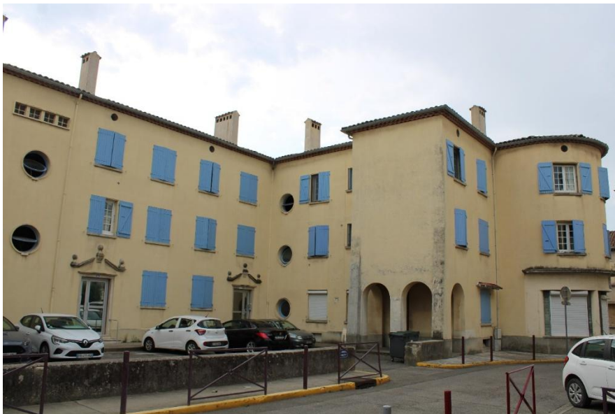
L'immeuble « Le Collectif », place François Lauzun à Bourg-Saint-Andéol