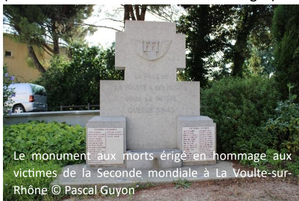
Le monument aux morts érigé en hommage aux victimes de la Seconde mondiale à La Voulte-sur-Rhône

les générations qui sont nées après leur survenue, afin de les leur rendre intelligibles. A côté de ce témoignage, est rappelé le contexte historique de l'été 1944, non seulement les bombardements qui ont touché la ville, mais aussi les exécutions auxquelles les Allemands ont procédé. On voit ainsi qu'ils s'inscrivent dans un même continuum historique, c'est-à-dire les drames qui ont précédé la Libération. Quatre photographies de bâtiments en ruine viennent l'illustrer. Elles donnent une bonne idée de l'ampleur des destructions provoquées par les bombardements. Celle qui a été prise dans la rue principale, correspondant à la route nationale 86, procure une sensation de désolation, nul bâtiment qui la longe n'est intact. A cette aune, on peut presque s'étonner qu'il n'y ait pas eu plus de victimes (44 au total, sur une population de 1 485 habitants en 1946, soit environ 3%). A droite, sont dressées les listes des tués et des blessés lors des bombardements. Figure également le bilan matériel de ces derniers (411 immeubles détruits ou endommagés).