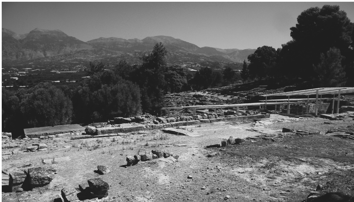
Fig. 3 : Veduta della catena montuosa del monte Ida a Nord di Haghia Triada, dall'area ad Ovest del Piazzale dei Sacelli.

In definitiva, il paesaggio potrebbe aver giocato un ruolo determinante nella scelta del fulcro insediativo di Haghia Triada e in particolare del luogo così a lungo adibito ad attività rituali, che sembrano potersi riferire in qualche modo ad un culto della memoria e degli antenati. La sacralità del Piazzale dei Sacelli potrebbe, quindi, essere, almeno in parte, dovuta alla sua posizione in un'area connotata da elementi paesaggistici che, nell'immaginario collettivo del tempo, erano riconducibili al confine tra il mondo dei vivi e quello dei morti e dunque al collegamento tra presente e passato, aspetto chiaramente rimarcato in ogni fase di utilizzo del luogo di culto.