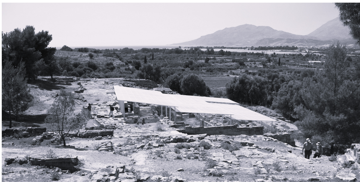
Fig. 2 : Veduta del settore meridionale di Haghia Triada, a sinistra il Piazzale dei Sacelli, sullo sfondo il golfo della Messarà e il letto del fiume Hieropotamos.

La predilezione per lo studio dei materiali e della continuità di culto ha finora determinato una minore attenzione per l'aspetto paesaggistico in cui il Piazzale dei Sacelli era inserito: non è ancora chiaro, per esempio, quale fosse l'effettivo rapporto di Haghia Triada con il mare e con il fiume che le scorre vicino 30 . Il costante rapporto visivo con questi elementi naturali, carichi di significati simbolici, potrebbe però aver conferito ad Haghia Triada e in particolare all'area del Piazzale dei Sacelli, da cui si gode di un'ottima vista del paesaggio circostante, una sacralità specifica. La scelta del fulcro culturale di Haghia Triada, forse già al momento stesso della fondazione del sito, sembra quindi essere determinata da aspetti ideologici strettamente connessi al rapporto visivo con la natura circostante, che conducono alla strutturazione di un vero e proprio paesaggio rituale 31 . In tal senso, vale la pena richiamare la definizione di Haghia Triada come una sorta di Sanctuary-Town proposta per il prestigio « metafisico » del sito 32 , ipotesi che potrebbe essere avvalorata dalla netta prevalenza di sistemazioni rappresentativo-culturali che si riscontra nel sito, soprattutto nei periodi di maggiore fioritura (Tardo Minoico I e III) e che sembra suggerire un impiego dell'insediamento per funzioni comunitarie specializzate 33 .