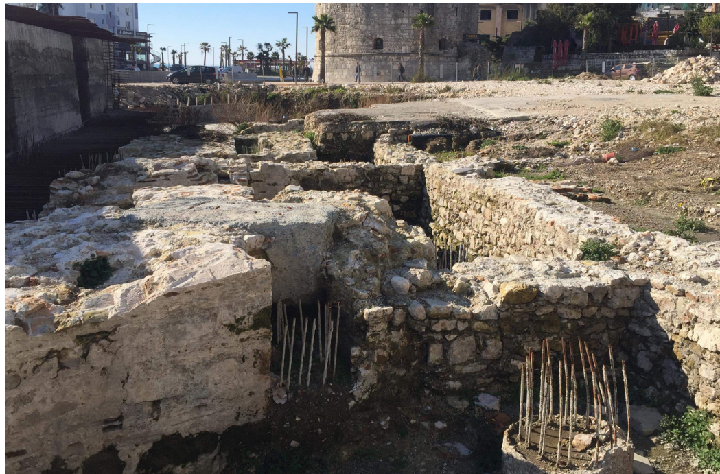
Chantier de Veliera : vestiges de différentes époques archéologiques endommagés par le réaménagement du centre-ville de Durrës, février 2018, Anxhelo Bici

Pour répondre à cet afflux de population, la construction de logements neuf devient un marché important. Dans les villes antiques comme Durrës (ancien Epidamne Dyrrachium ), Lezha ( Lissus ), Vlora ( Aulona ) etc., les constructions se font souvent au-dessus des vestiges archéologiques qui sont rasés en amont.