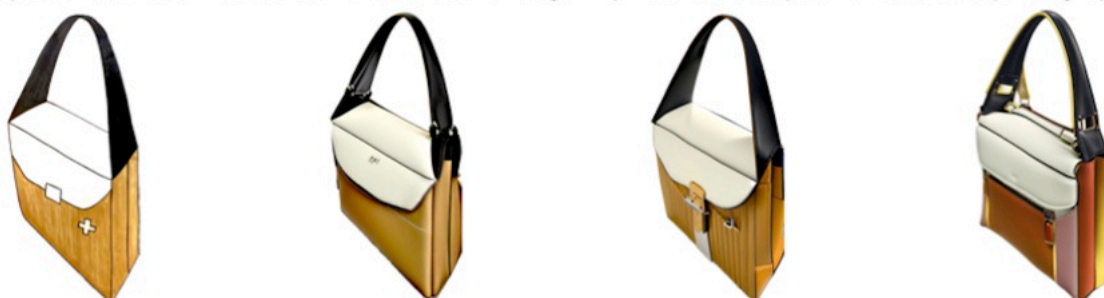
Original par A. Tarsiguel

Requête : futuristic wearable, two tone leather bag, 4k photorealistic, pack shot, studio photography