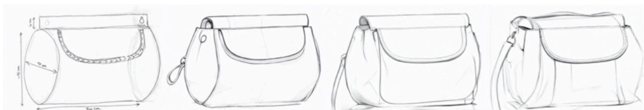
Original par V. Sanchez

Requête : black and white designer sketch of a handbag