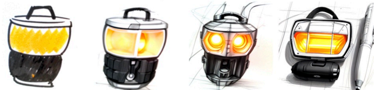
Original par J. Haag

Requête : designer sketch of a transportable warm color led lamp for trekkers and backpackers, minimalist flashlight, handheld, neo-futuristic.