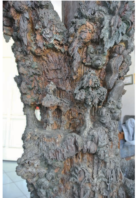
Fig. 7 – Détail de la partie médiane du tronc. Le pavillon à toits superposés (disparu) entre les arbres (H. Njoto, juillet 2014).