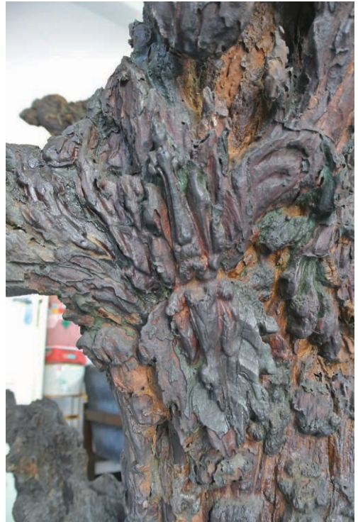
Fig. 12 – Détail de la branche la plus longue. Fleuron, au centre le motif de vajra (?). (H. Njoto, juillet 2014).