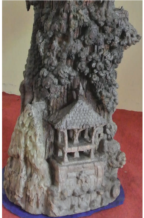
Fig. 9a – Détail de la partie médiane du tronc. Le décor de volutes (H. Njoto, novembre 2013).