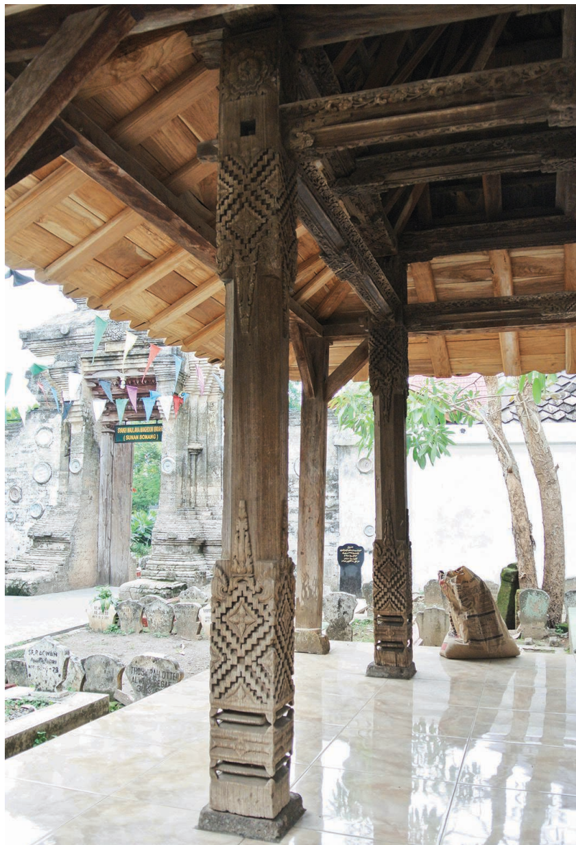
Fig. 15 – Les mêmes piliers sculptés conservés dans l'avant-cour du complexe funéraire de Sunan Bonang à Tuban (H. Njoto, novembre 2013).