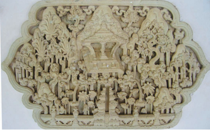
Fig. 16 – Relief du complexe funéraire de Mantingan (H. Njoto, 2005).