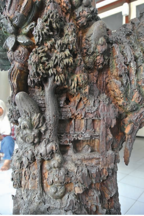
Fig. 8 – Détail de la partie médiane du tronc. Le pavillon à double plancher, très abimé et les protubérances évoquant des collines (H. Njoto, juillet 2014).