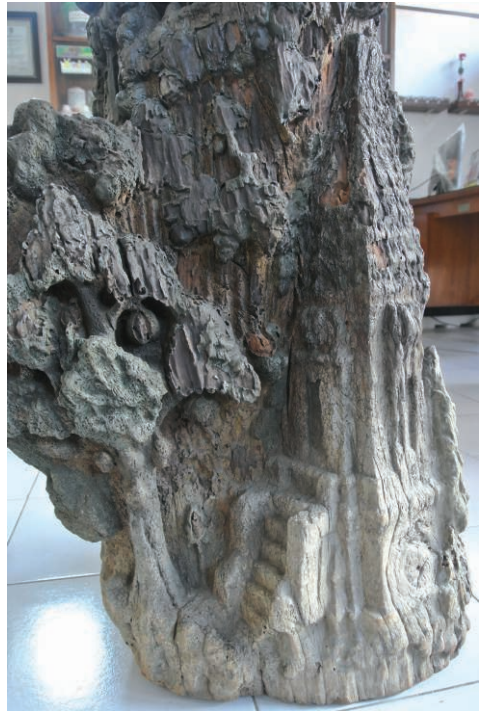
Fig. 5 – Détail à la base du tronc. Sanctuaire avec son escalier à échiffres (H. Njoto, juillet 2014).