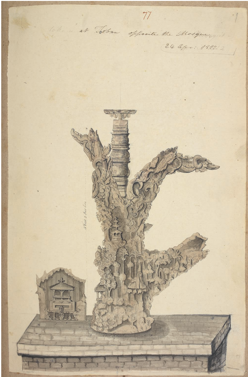
Fig. 13 – Anonyme, pièce sculptée en bois du musée Kambang Putih de Tuban. Encre, lavis et aquarelle. Inscription à l'encre sur crayon en haut : « Taken at Tooban opposite the Mosque ». Daté en haut à droite : « 24 Apr : 1812 ». 38,6 x 25,2 cm. Coll. British Library, India Office Library. WD 953 f. 69 (77).