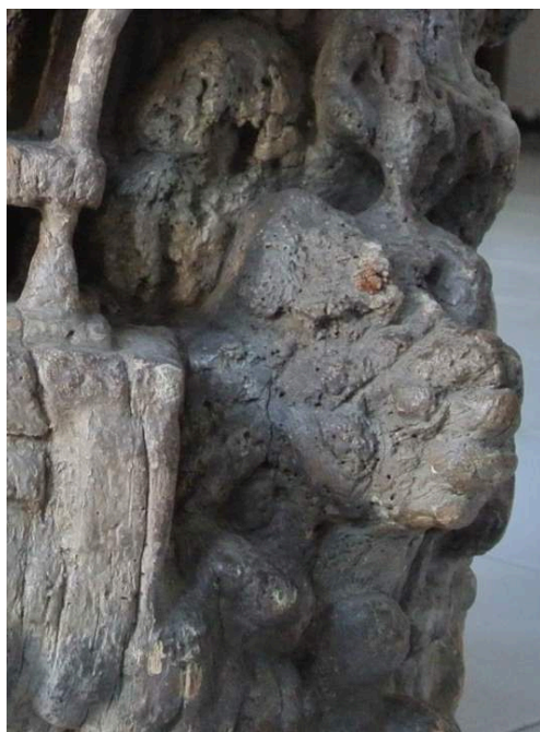
Fig. 3 – Détail à la base du tronc. Tête monstrueuse, très abimée.