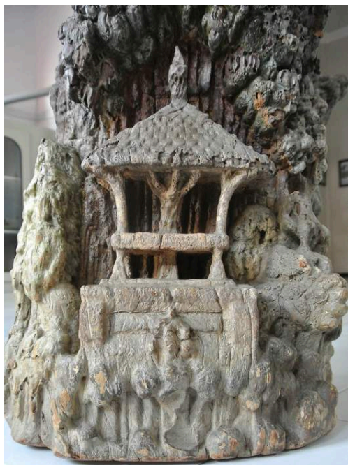
Fig. 2 – Détail de la base du tronc. Pavillon miniature au pilier central à huit branches (H. Njoto, juillet 2014).