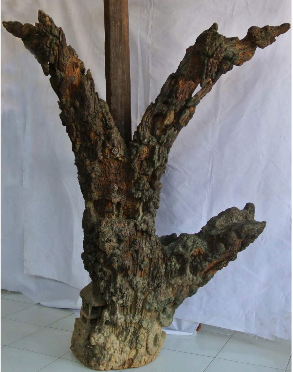
Fig. 1. – La pièce de Tuban ou « kalpataru ». Salle de conservation du musée Kambang Putih à Tuban (H. Njoto, juillet 2014).