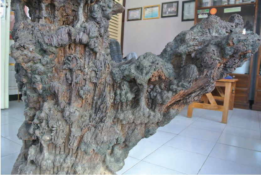
Fig. 6 – Détail de la branche transversale. Le paysage sylvestre avec les rondiers ou aréquiers (H. Njoto, juillet 2014).