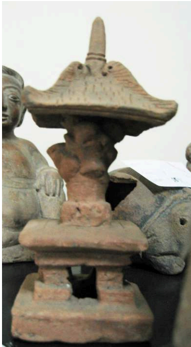
Fig. 17 – Miniature en terre cuite représentant un pavillon à pilier unique, 7 x 7 cm, hauteur 17 cm, coll. Soedarmadji Jean Henry Damais (H. Njoto, 2009).