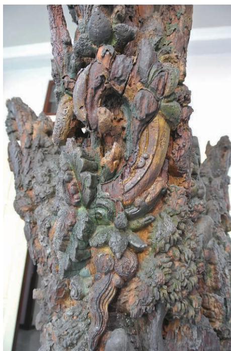
Fig. 10 – Détail de la branche la plus longue et la mieux conservée. Le décor de motifs géométriques et floraux (H. Njoto, juillet 2014).