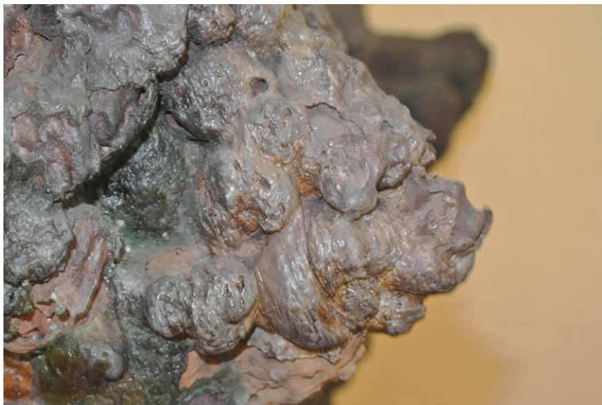
Fig. 9b – Détail de la partie médiane du tronc. Tête animale ou monstrueuse (H. Njoto, novembre 2013).