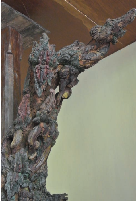
Fig. 11 – Détail de la branche la plus longue. Le motif serpentin enroulé le long de la branche.