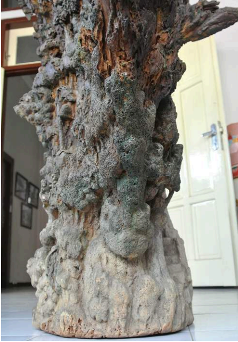
Fig. 4 – Détail à la base du tronc. Figure humaine accroupie.