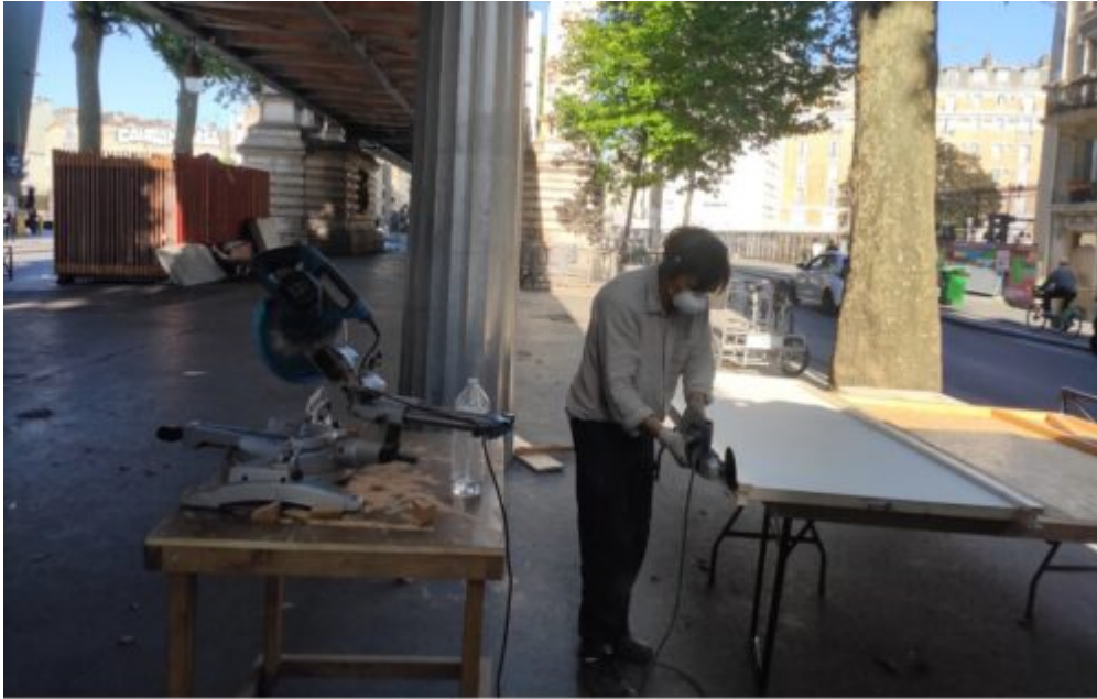
Figure 4 : Le référent atelier et chantier d'insertion de VU s'attèle à la construction de la cuisine.

un « bien commun de proximité » (Breviglieri, 2023) qui assume l'ambition de répondre à une pluralité de besoins et d'inciter l'émergence de nouvelles configurations spatiales que prendrait cet espace public selon l'investissement de ses usager.ère.s.