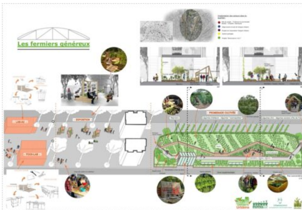
Figure 3 : Plan du projet des Fermiers Généreux situé bd de la Chapelle.

partagés ou familiaux, et peut investir d'autres espaces plus ou moins ordinaires » et pour finir, nourrit l'ambition de rejoindre le mouvement contemporain des « communs urbains » (les citations précédentes viennent de : Goetzler, 2020).