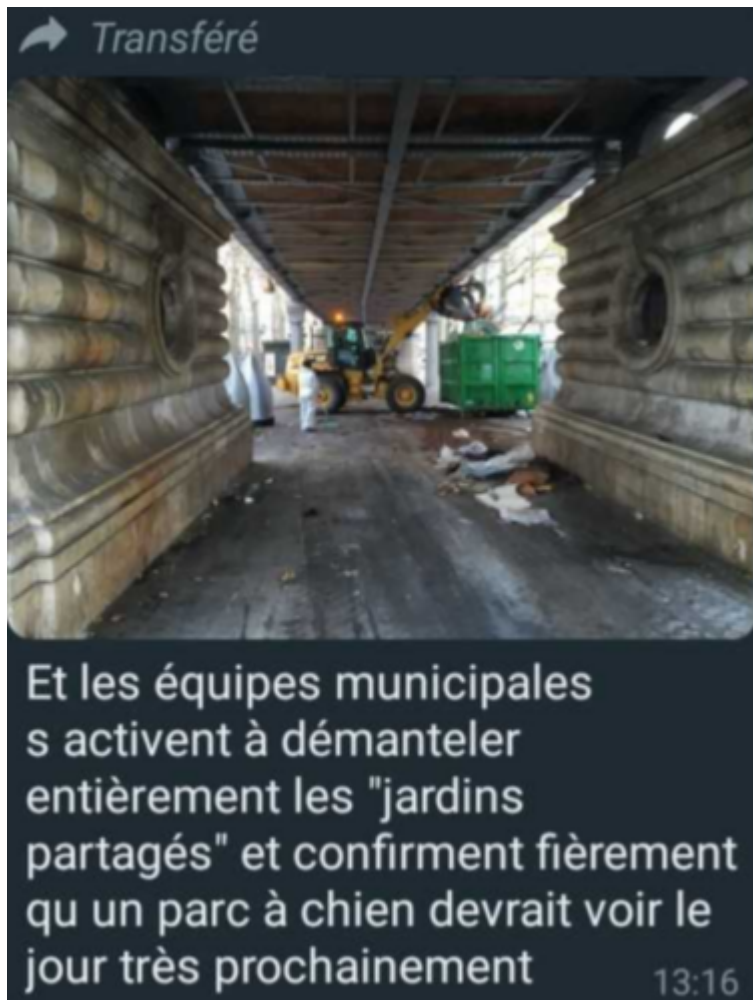
Figure 8 : Partage sur le groupe WhatsApp quant à l'opération de démantèlement.