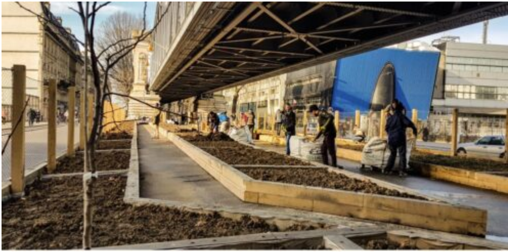
Figure 1 : Chantier participatif pour l'aménagement du jardin partagé. Source : Vergers Urbains, 2020.