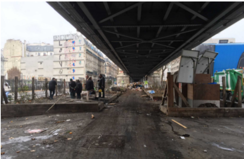
Figure 2 : Le même jardin en cours de démantèlement.