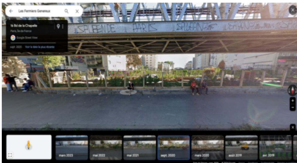
Figure 6 : Street view du 16 bd de la Chapelle.