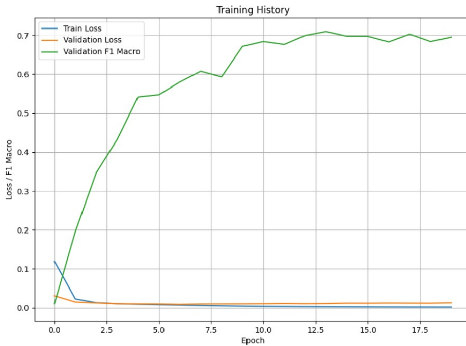
FIG. 2 – Évolution des pertes et de la F1-mesure macro de validation pour le modèle BTransformer18 avec CamemBERT-Large .

généralisation, montrant l'efficacité du modèle pour capturer des relations complexes tout en évitant le surapprentissage. En exploitant les avancées récentes en traitement du langage naturel, notre modèle démontre sa capacité à relever le défi de l'extraction automatique de relations complexes, tout en maintenant une classification précise grâce aux couches Transformer.