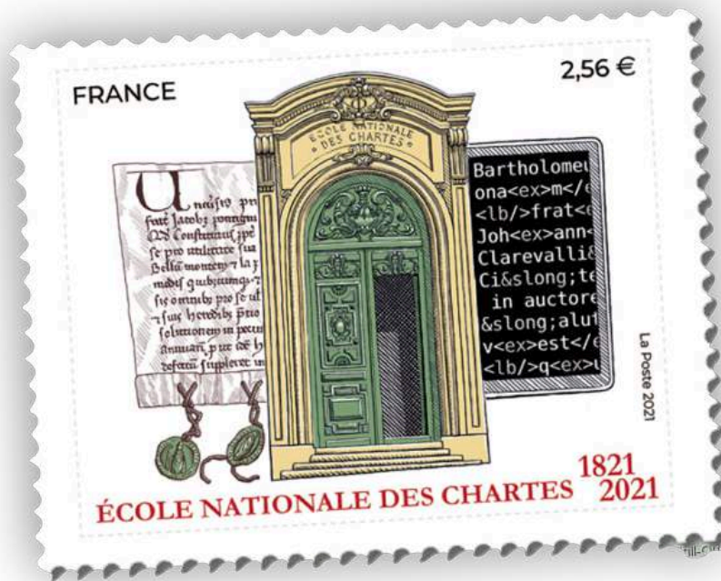
Figure 2 – Timbre émis en 2021 pour le bicentenaire de l'École nationale des chartes