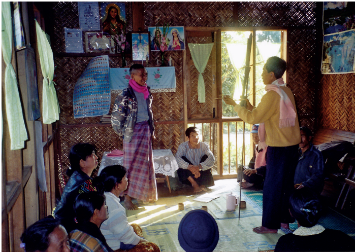
Fig. 5. Offrande ri-nhtu de mayu à dama

À l'issue de la cérémonie, la courte mais très solennelle offrande ri-nhtu est effectuée. Elle vaut solde de tout compte, condition nécessaire au renouvellement du pacte social entre les deux groupes. La hiérarchie donneurs-preneurs est respectée jusque dans la gestuelle. Le représentant des mayu en position debout tend les deux armes ficelées ensemble au représentant des dama en position agenouillée, la main du premier au-dessus de la main du second (fig. 5). Si la relation mayu dama est ainsi strictement régulée par les échanges de biens rituels, la possibilité d'un « substitut » permet, là encore, d'atténuer les contraintes en rendant possibles toutes sortes d'aménagements.