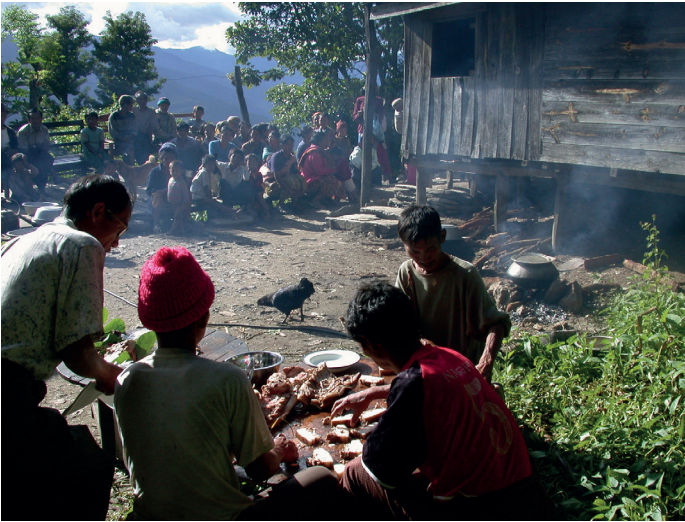
Fig. 3. Partage de viande à Saizang

L'échange de biens rituels et le partage de viande font l'objet d'une scrupuleuse codification au sein des consanguins et des alliés au sens large. À chaque partie d'un animal sacrifié, buffle ou porc, correspond un récipiendaire : 1) le sang recueilli est la nourriture des esprits ; 2) les cuisseaux arrière sont attribués aux chefs ou aux personnes de haut rang ; 3) les autres membres de la parentèle reçoivent tel ou tel morceau de viande en tenant compte de la hiérarchie hpu-nau , mayu , dama ainsi que de la proximité géographique. Les échanges de biens rituels obéissent à une logique similaire.