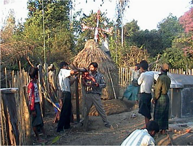
Fig. 4. Creusement par les mayu du veuf d'une douve autour de la hutte funéraire

Le dernier jour du rituel de secondes funérailles, une hutte funéraire végétale ( hkinchyang ) est érigée à proximité de la tombe, et une douve creusée tout autour par les représentants du clan Nhkum dont est originaire la défunte (fig. 4).