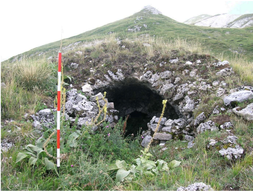
Figure 12 – Structure hypogée au lieu-dit Mandrucce (site T26).