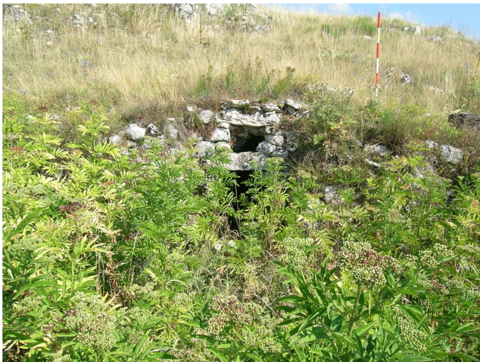
Figure 4 – Structure hypogée à Costa Tre Colli (site T18).