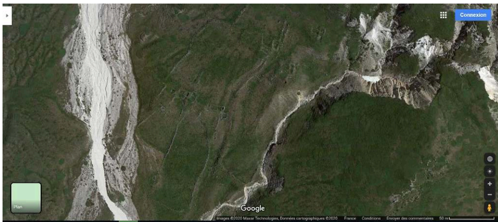
Figure 13 – Enclos et structures agro-pastorales au lieu-dit Mandrucce (site T26).