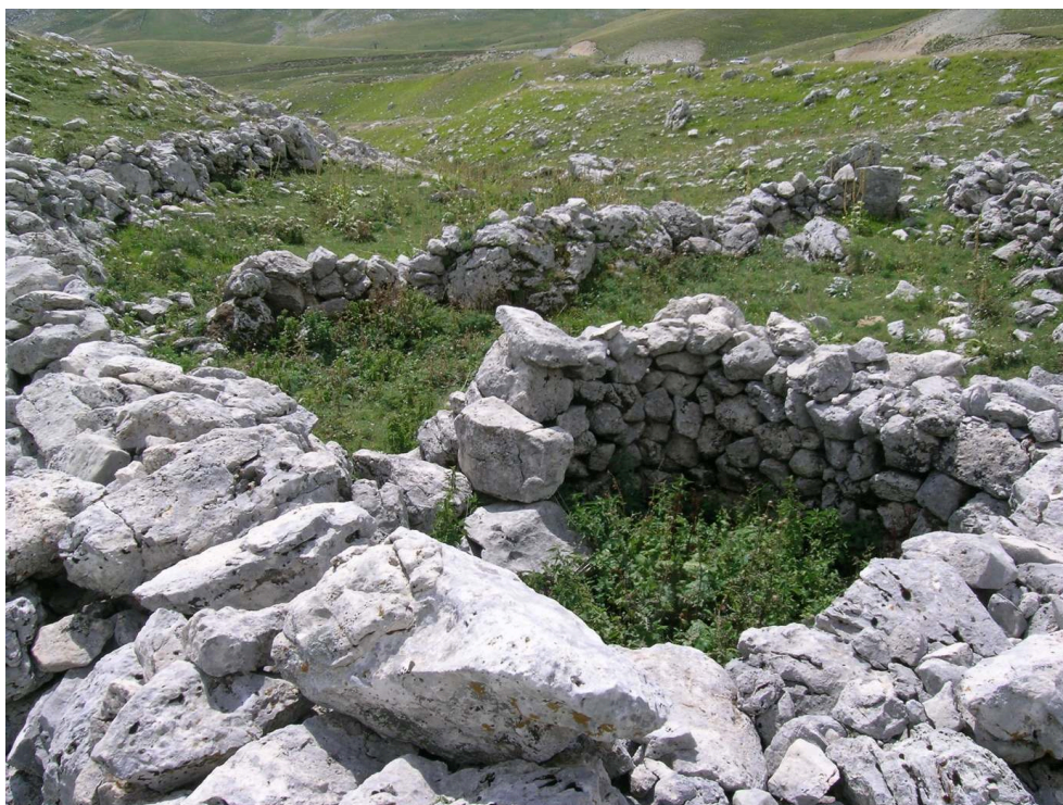
Figure 9 – Cabane et enclos au lieu-dit Fontari (site T25).