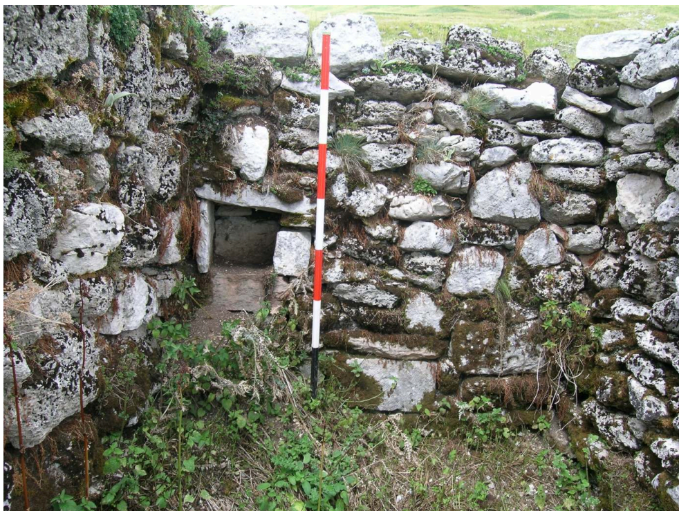
Figure 11 – Mur avec niche au lieu-dit Mandrucce (site T26).

quadrangulaires, circulaires, enclos) sont visibles en photographie aérienne sur le même versant.