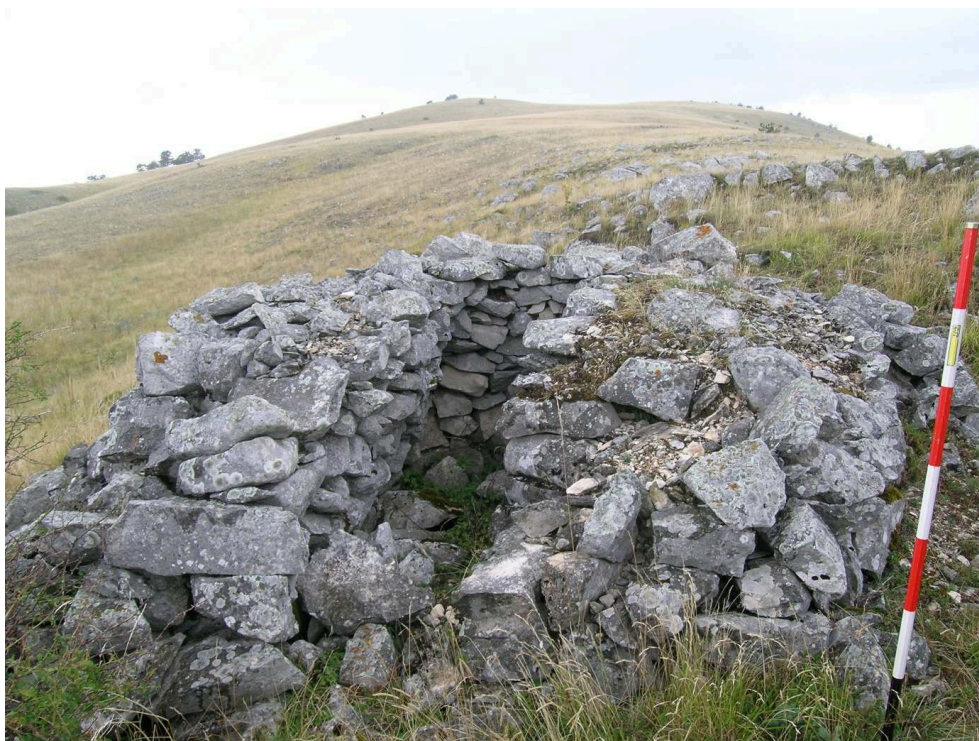
Figure 8 – Cabane au col entre Monte Mesola et Monte Cecco d'Antonio (site T24).