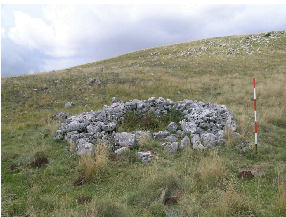
Figure 7 – Cabane ovoïde de Campo delle Ginestre (site T23).