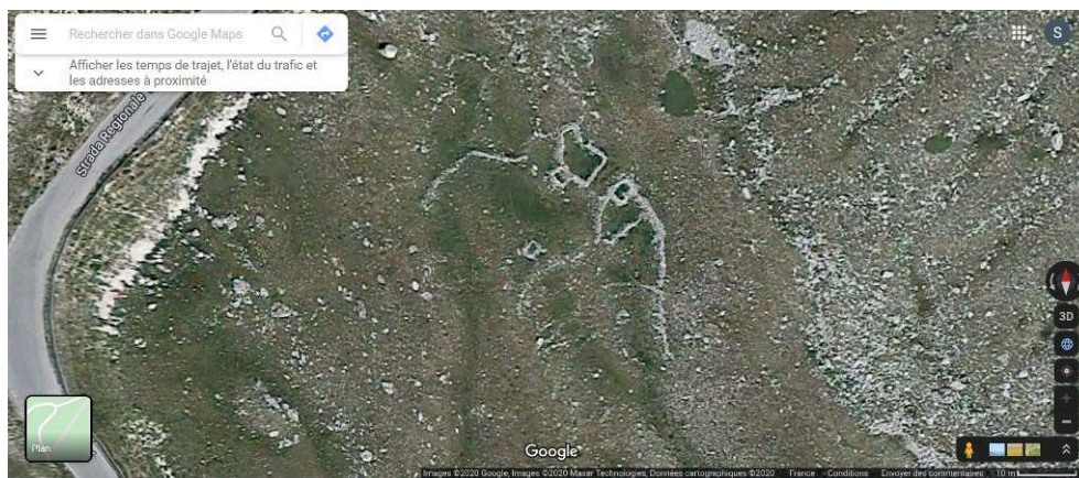
Figure 10 – Cabanes et enclos au lieu-dit Fontari (site T25).