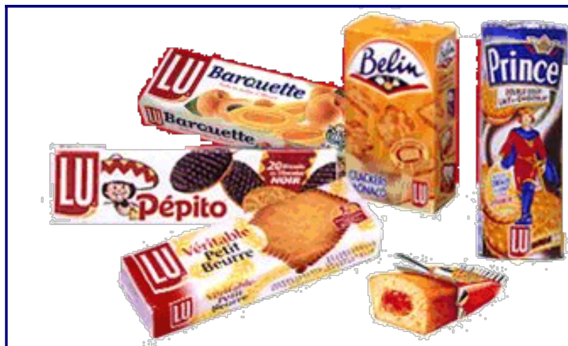
illustration n° 2

Sur l'emballage, la disposition graphique permet de distinguer nettement le Nm q du Npd (c'est le cas des trois emballages à gauche de l'illustration n°2). De plus le Nm q est le plus souvent sous forme de logo, ce qui permet un repérage rapide même si la disposition change. Nm q et Npd n'appartiennent pas au même paradigme. On le constate même dans les cas particuliers où deux noms de marques figurent sur l'emballage : le Nm q BELIN est mis en avant alors que le Nm q LU est placé comme une signature, en bas à droite. Ce choix peut s'expliquer par le contexte extralinguistique (notoriété de BELIN sur le marché des gâteaux apéritifs, LU n'étant que le fabricant...) mais quels que soient les scénarios possibles, l'important est que, même dans ce cas, le paradigme Nm q /Npd reste différencié. CRACKERS MONACO, en bas à gauche entre bien dans le paradigme des Npd. On constate que le paradigme des Npd inclut indifféremment des ND (PEPITO, BARQUETTE, PRINCE, CRACKERS MONACO) et des noms qui ne le sont pas ( petit beurre ).