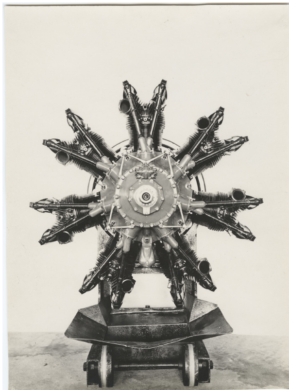
Éditions Paul-Martial, Moteur d'avion, 1932, papier baryté au gélatino-argentique.