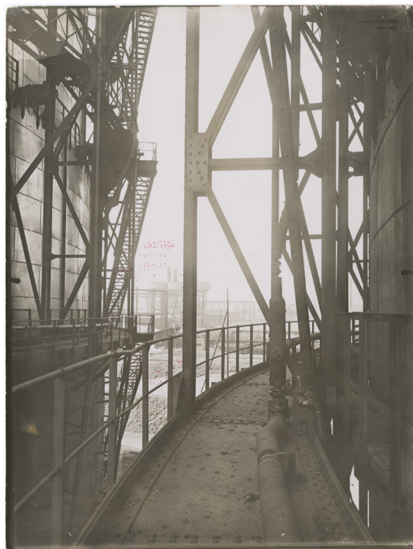
Éditions Paul-Martial, Vue extérieure d'usine, 1929, papier baryté au gélatino-argentique.