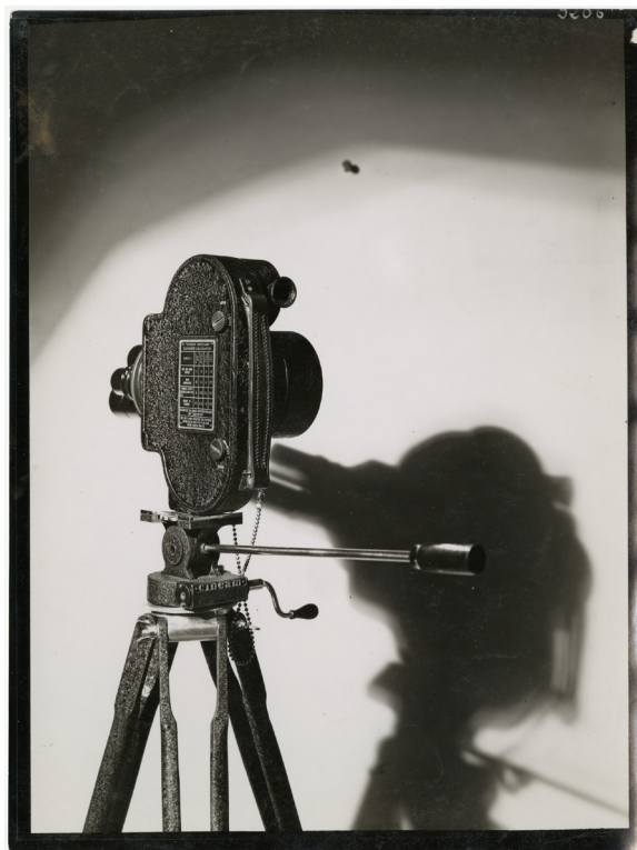
Éditions Paul-Martial, Caméra superkinecam, 1932, papier baryté au gélatino-argentique.