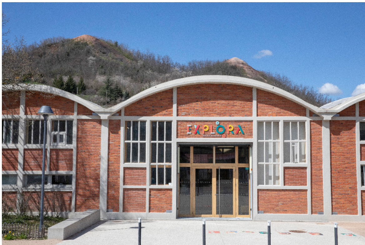
Le bâtiment Explora. Avec cet espace, La Rotonde dispose d'un lieu dédié à l'innovation équipé de nombreux équipements de bricolage classique et de machines à commandes numériques.

populaire, les collectivités territoriales, l'industrie, etc. Nourrie de son expertise, de son histoire et située à la bonne échelle, elle a ainsi tous les ingrédients en main pour s'inscrire dans ces nouvelles évolutions nationales et pour y répondre en étant force d'innovation et d'impact sur les publics.