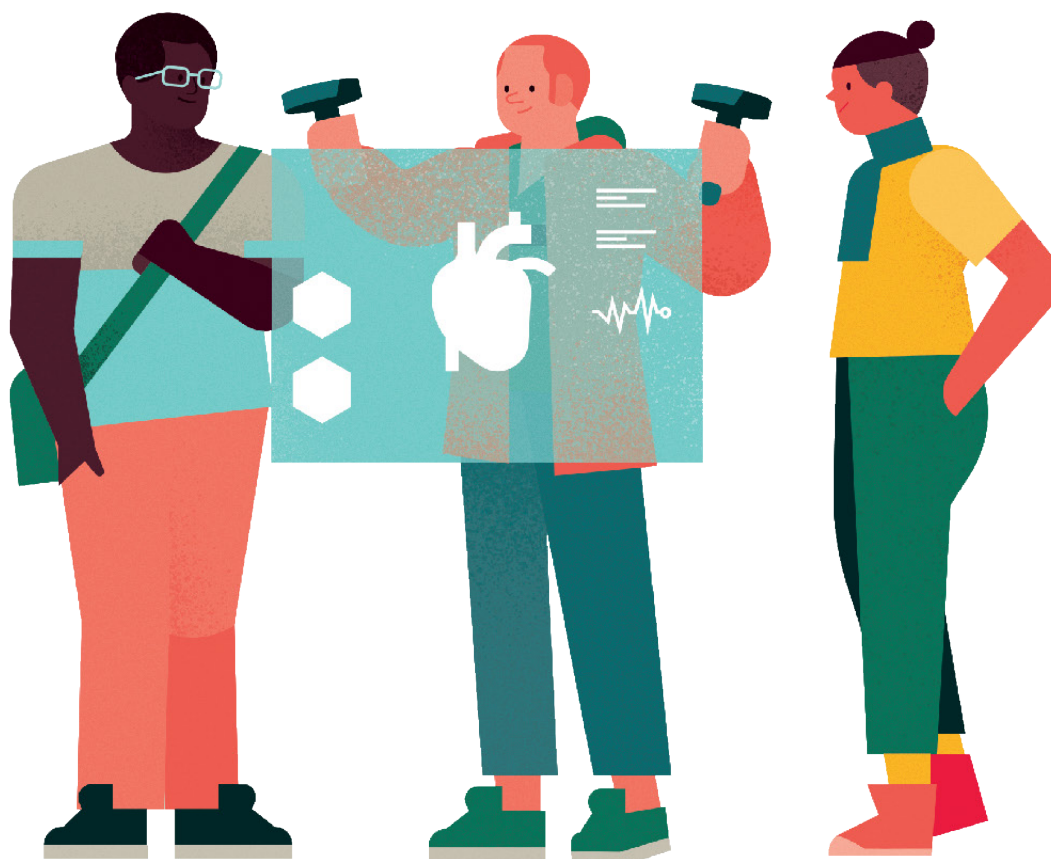
Atelier de prise au réel : sortir les outils de la recherche des laboratoires.