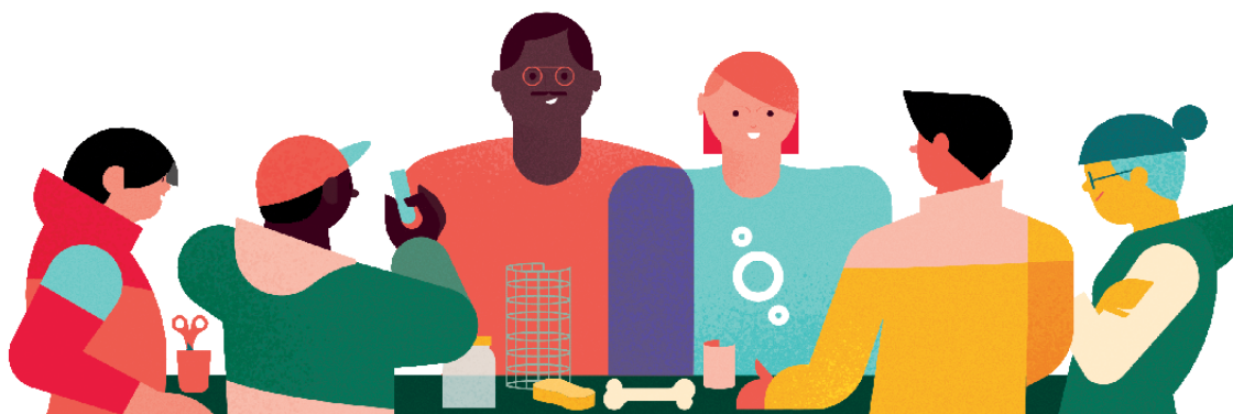
Le binôme médiateur-chercheur : de la co-conception à la co-animation.

débats, ou encore de l'aide à la décision publique, il s'agit pour eux de développer un dialogue avec le grand public. Ce contexte favorable a permis d'instaurer une nouvelle dynamique collaborative entre le monde de la recherche et celui de la culture scientifique.