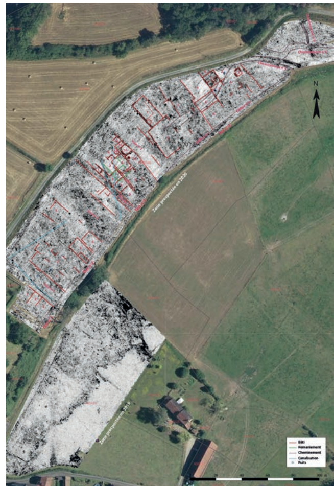
Ahun (Creuse), zones prospectées au géoradar en 2019 et 2020 (AGC), avec tracés interprétatifs

Deux nouvelles zones ont été définies pour la campagne de prospection 2021, au plus près du sanctuaire monumental et des zones déjà prospectées au géoradar en 2019 et 2020. Le but est à terme d'obtenir une image cohérente, avec la même méthode de repérage, de l'environnement immédiat du sanctuaire et des aménagements (construction, voiries) qui l'entourent. En fin d'année 2021, le rapport d'AGC n'était pas rendu. Seules quelques images non retravaillées permettent de premières observations et hypothèses. La zone prospectée en 2021 couvre une vaste superficie à l'est des deux bâtiments du