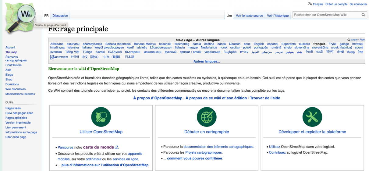
Illustration 2 : Wiki de la communauté OpenStreetMap.

La contribution à des communs s'inscrit dans le plan d'action logiciels libres et communs numériques du gouvernement lancé en 2021 dont l'un des objectifs est de mieux connaître et utiliser les logiciels libres et les communs numériques. En éducation, contribuer à des communs numériques est une occasion d'aborder les principaux concepts des sciences numériques, mais également de permettre aux élèves, à partir d'un objet technologique, d'appréhender le poids croissant du numérique et les enjeux qui en découlent. Ce type de projets permet aussi de développer leurs compétences numériques .