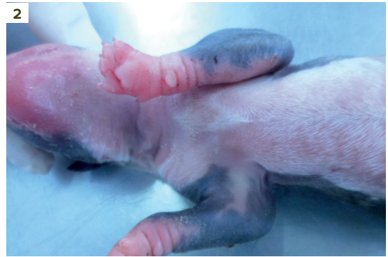
2. Chiot prématuré. Le développement du pelage sur la tête et les membres est faible.

Tout l'historique de la mère, ainsi que des autres chiennes du même élevage, peut se révéler important dans l'interprétation des résultats obtenus. Certains médicaments donnés lors de la gestation (progestérone, corticostéroïdes, doxycycline, etc.) peuvent être tératogènes, expliquant les anomalies congénitales, ou toxiques pour les chiots pendant la lactation, et à l'origine d'un retard de croissance, d'une diarrhée, de signes neurologiques, etc. [6, 9]. Une dystocie observée chez la chienne est parfois la cause d'un syndrome de détresse respiratoire chez le nouveau-né. De plus, un comportement maternel inadéquat peut provoquer un traumatisme (comme un écrasement) ou un abandon. Ce dernier a pour conséquence l'absence de prise colostrale, ce qui a pour effet d'augmenter le risque d'infection bactérienne chez les nouveau-nés, en lien avec un déficit de transfert passif de l'immunité [3]. Enfin, toutes les affections de la mère pendant la période post-partum , notamment une mammite, peuvent entraî-