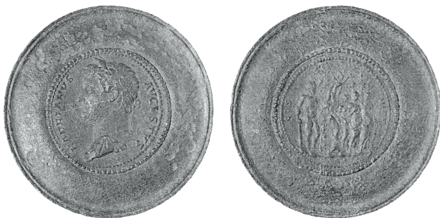
Figure 4 - Médaillon d'Hadrien conservé à Aquilée ( ; 65 mm ; × 0,86).