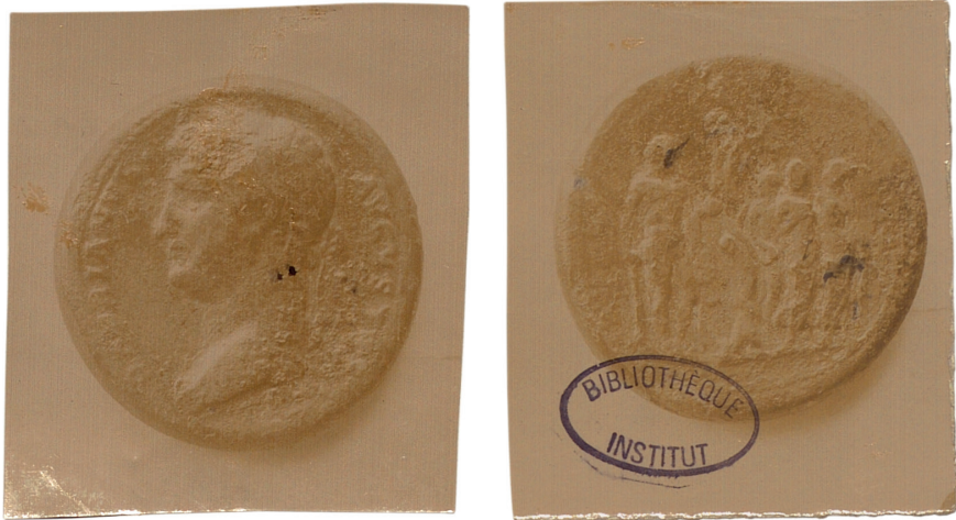
Figure 3 - Photographies du médaillon de Reims trouvé en 1894