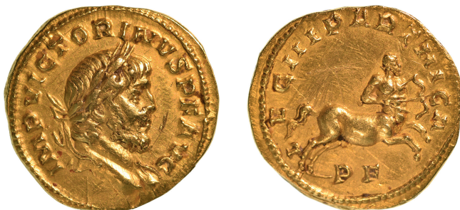
Figure 1 - Aureus de Victorin trouvé dans le théâtre d'Orange, Cologne, 4 e émission, ca 270, émission légionnaire (Musée d'art et d'histoire d'Orange ; or ; 5,55 g ; 20 mm ; 12 h ; × 2).

E. - ; LAFAURIE 1975 - ; SCHULTE 1983, n. 32 ; RIC V.4, 608, pl. 72.