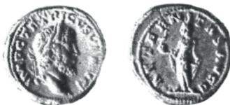
Figure 2 - Aureus de Tétricus I er trouvé dans le théâtre de Vienne, d'après les photographies publiées par A. Vassy en 1936, Trèves, 4 e émission, ca moitié 272-moitié 273 ? 7 (or ; 4,60 g ; 20 mm ; 5 h).

E. 835, p. 89 (début 273-début 274) ; LAFURIE 1975, p. 948 ; SCHULTE 1983, 72a, pl. 27 (D/ 48 - R/ 52) Trèves, groupe 8, 10 décembre 273-février 275) (photo originale, cet exemplaire) – RIC V.4, 714, pl. 80 (moulage, cet exemplaire).