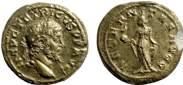
Figure 3 - Moulages de l' aureus de Tétricus I er (Musée de Vienne ; cliché : V. Borrel ; × 2).

Malheureusement, cet exemplaire, entré dans les collections des musées de Vienne, comme indiqué par A. Vassy en 1936, a disparu dans les années 1970 16 et seul un moulage doré 17 y est maintenant conservé (figure 3).