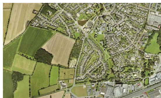
Figure 2. Vue aérienne du quartier "les hauts de Couzé". Le parcellaire, la trame verte et bleue ainsi que les mobilités douces sont reliés à l'existant.