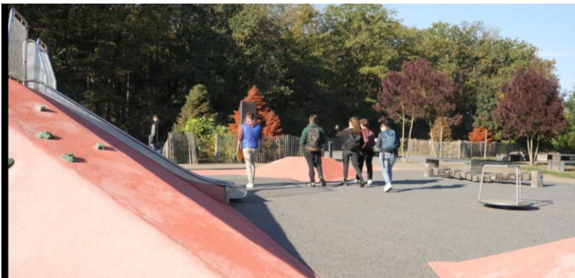
Figure 4. Immersion du groupe sur site.

Après l'immersion, le partage d'expériences s'est organisé comme suit :