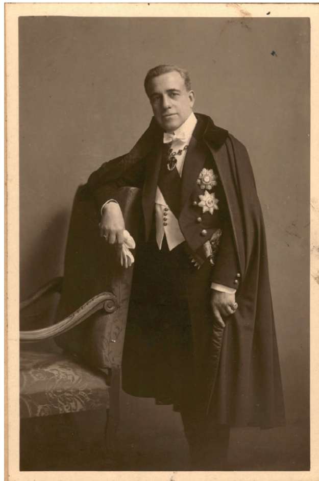
Fig. 1. Retrato de Carlos Magalhães de Azeredo. Roma, 1934.

Carlos Magalhães de Azeredo (fig. 1) nasceu na capital fluminense em data simbólica para os brasileiros: 7 de setembro, Dia da Independência. Órfão de pai, mudou-se ainda pequeno com a mãe para Portugal para viver com o avô no Porto. Depois da morte deste, a mãe decidiu regressar ao Rio de Janeiro com o filho. De volta